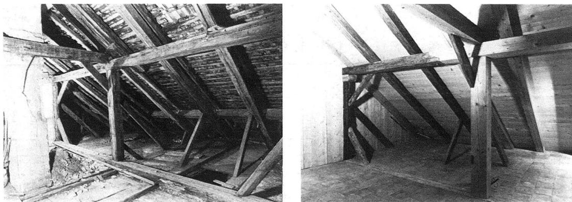
Abb. 4/5. Zug, Burg. Estrichraum vor und nach der Restaurierung. Isolierung des Daches oberhalb der alten, aufgedoppelten Sparren, möglichst weitgehende Erhaltung des alten Materials

Sind so im Altbau Installationen kaum sichtbar, so enthält er doch verdeckt manches, was man sich noch vor wenigen Jahrzehnten nicht vorgestellt hätte. Unsichtbar fängt ein feingliedriges Stahlskelett die Kräfte entlang den Aussenwänden des Fachwerkbbaus ab und entlastet die alten Holzkonstruktionen, die durch mannigfache Veränderungen in ihrer Kraftschlüssigkeit schlecht erfassbar geworden waren, als biographisches Lesebuch aber um so interessanter sind.