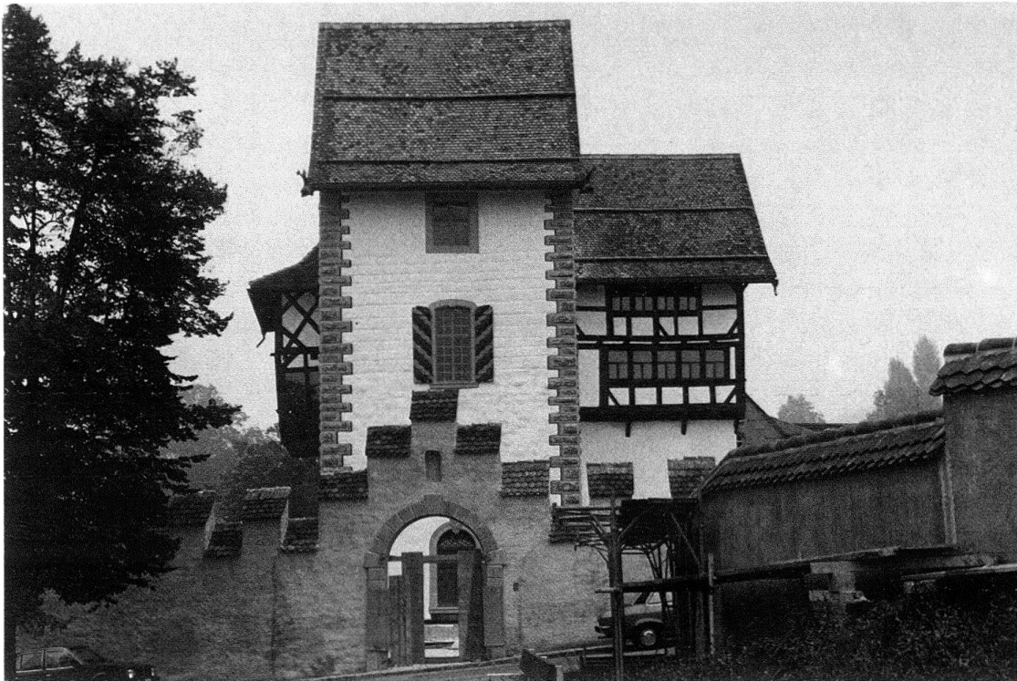
Abb. 1. Zug, die restaurierte Burg von Süden, kurz vor Abschluss der Arbeiten. Am Turm zeigen die horizontalen Mauerfugen die Höhe des kyburgischen Mauerwerks an. Giebel, Eckquaderbemalung und Fachwerkbau zweite Hälfte des 16. Jahrhunderts