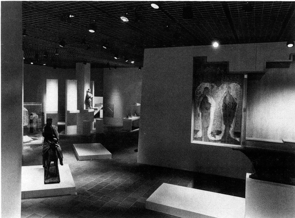
Abb. 6. Zug, Burg. Unterirdischer Saal während der Einrichtung der Ausstellung

Im Zwischenraum zwischen Aussenwand und Täfelung verbirgt sich nicht nur dieses statische Element, sondern auch die Wärmeisolation, ebenso Leitungen für Licht, Telefon, Ruf-, Feuer- und Diebstahl-Warnanlage. Ausser in Räumen, wo der Originalboden erhalten werden musste, wurde eine Bodenheizung installiert. Auf Klimatisierung wurde verzichtet. Hingegen erlaubt eine Lüftung , die relative Luftfeuchtigkeit in den Museumsräumen zu regulieren. Weil der Einbau eines Lüftungs-Röhrensystems zerstörerische Eingriffe in die Gebälke verursacht hätte, beschritt man einen unkonventionellen Weg, indem die Luft ins Untergeschoss eingeblasen wird, durch die vorhandenen Öffnungen des Gebäudes nach oben steigt und in den einzelnen Räumen durch Kleinventilatoren ins Freie abgesogen wird.