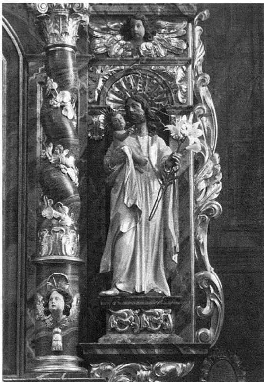
Abb. 3. Vild, hl. Joseph, 1685. Detail des Hochaltars