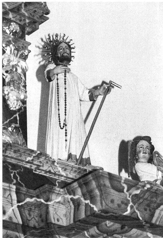
Abb. 4. Vild, Bruder Klaus, 1685. Detail des Hochaltars

schen Orte bringen zu wollen 15 . Gleichzeitig wurde dem Landvogt von Luzern aufgetragen, auch die übrigen katholischen Orte über die Angelegenheit zu informieren. Erst im Juli 1743 wurde der Landvogt auf der Tagsatzung der katholischen Orte angewiesen, einen Kostenvoranschlag für die Fassung des Altars vorzubereiten 16 . In einem am 7. August 1743 an Luzern gerichteten Schreiben nimmt der Sarganser Landvogt Franz Josef Müller (1743–45), ein Obwaldner, Bezug auf den Beschluss der katholischen Orte in Frauenfeld vom 30. Juli. Darnach war ein Akkord in der Höhe von 72 Florin mit einem Rapperswiler Maler zur Fassung des schon anno 1685 errichteten, «biss dato aber ohngefasst stehenden Choraltars» der Unbefleckten Empfängnis geschlossen worden 17 . Luzern genehmigte den Akkord am 16. Dezember 1643 18 , die katholischen Orte taten ein Gleiches auf ihrer Konferenz im Juli 1744 19 .