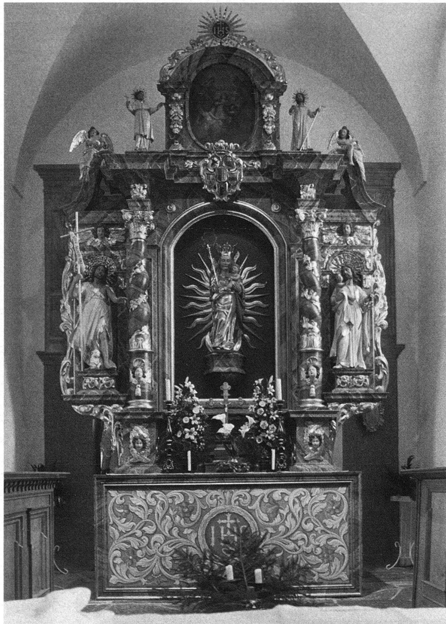
Abb. 2. Der Hochaltar der Kapelle Vild bei Sargans, der Unbefleckten Empfängnis Mariens geweiht, 1685. 1979–81 wiederhergestellte Fassung von 1744