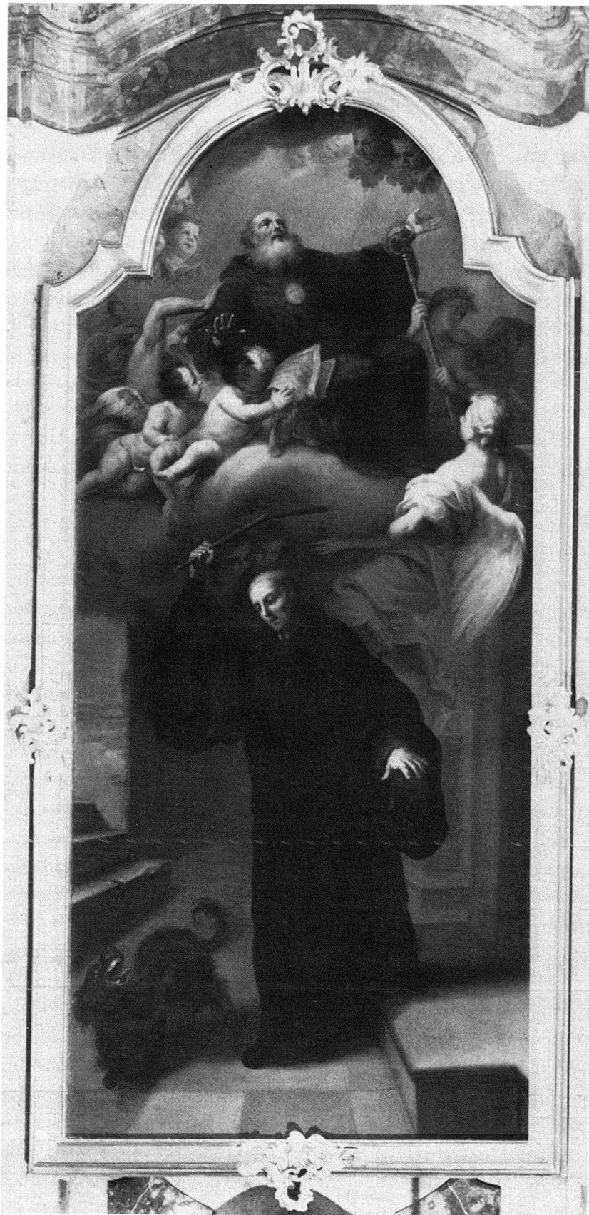
Abb. 1. St. Gallen Kathedrale. Blatt des Notker-Altars