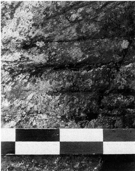
Abb. 1. Ober Gurtellen UR. Umgehungsweg der Reuss-Schluchten zwischen Wiler und Amsteg. Die Trittrillen, die das Ausgleiten von Fuss und Huf verhindern sollen, sind von der Begehung während Jahrhunderten fast wieder ausgelöscht (Koord. 691 37/17824. Massstab mit 10-cm-Teilung)

Verkehrswege sind Zeugen der Kultur, wer möchte das bezweifeln? Grosser St. Bernhard, Schöllenen–St. Gotthard, Viamala: grosse Namen der Schweizer Geschichte. Die Geschichte der Wege, Strassen, Eisenbahnlinien ist ein zentraler Teil der Geschichte des Passlandes Schweiz, wie wir alle in der Schule gelernt haben. Und doch: Der Abbruch der einst monumentalen Axenstrasse läuft auf vollen Touren; um die kläglichen Reste der eigentlichen (der mittelalterlichen, im Jahr 1888 eingestürzten) Teufelsbrücke scheint sich kein Mensch zu kümmern; die eindrückliche Kunststrasse in der Schlucht des Monte Piottino bricht Stück um Stück ins Felsenbett des kärglich fliessenden Tessin. Das sind nur drei Stationen auf dem Leidensweg des alten Sankt Gotthard. – Und eben in diesem Heft muss ein Architekt feststellen, dass die Sustenstrasse – wer erlebte nicht schon fasziniert ihre Bilderbuchszenerien? – ein Kunstwerk ist, ein Kunstwerk, von dem der offizielle Kulturbetrieb bisher keine Notiz genommen hat. Zur Probe: Der «Kunstführer durch die Schweiz» erwähnt zwischen Wassen und Innertkirchen die Meianschanze und zwei Maillart-Brücken, aber mit keinem Wort die Strasse selbst.