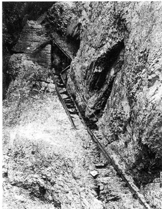
Abb. 2. Flims-Fidaz GR. Der Leiteraufstieg zu den Pinutwiesen wird bereits im 18. Jahrhundert erwähnt. Die jetzige Stahlkonstruktion ist zu grossen Teilen von Steinschlag zerstört, seit sie nicht mehr unterhalten wird