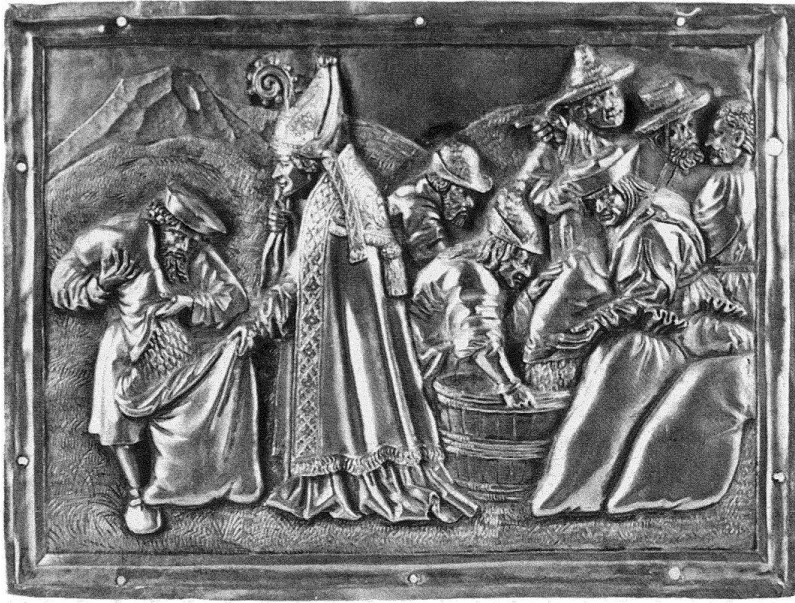
Freiburg, Münsterschatz: Kleines Relief (12,2 × 16,4 cm) mit der Szene der wunderbaren Be- schaffung von Korn in der Hungersnot aus der Vita des Nikolaus v. Myra. Vermut- lich Rest einer grossen Sil- berstatue des Augsburger Goldschmieds Silvester Nathan, zwischen 1514 und 1518.

praktisch stehengebliebene Forschung über die Freiburger Goldschmiede generell wieder aufzunehmen ist. Überdies führte die Veröffentlichung von Montenachs Schatzverzeichnis aus dem Jahre 1661 zur Feststellung, dass die umfangreichen Archivalien zum Münsterschatz weitgehend brachliegen 1 . Im Rahmen der Ausstellungsvorbereitung konnten die Schatzverzeichnisse und die Kirchmeierrechnungen weitgehend systematisch aufgearbeitet werden. Die Ausstellung und der hierzu erarbeitete (durchgehend zweisprachige) Katalog konnten die vielschichtige Arbeit punktuell nachholen, wollen jedoch in erster Linie der weiteren Forschung Anregung und Ansporn sein.