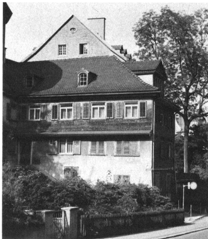
Abbildungsnachweis Source des illustrations Fonti delle illustrazioni

Vor zwei Jahren hatte der Kanton als Besitzer der Liegenschaft ein Abbruchgesuch für das Haus «Zur Moosburg» eingereicht. Gegen die von der Baupolizeikommission erteilte Abbruchbewilligung hatte der Heimatschutz Rekurs beim Stadtrat eingereicht. Im Einvernehmen mit allen Beteiligten wurde in der Folge der Denkmalpfleger der Stadt Bern, B. Furrer, mit der Ausarbeitung eines Gutachtens beauftragt. Demnach sei das Haus zwar nicht derart wertvoll, dass sich die Unterschutzstellung rechtfertigte, ein Abbruch würde jedoch das städtebauliche Gesamtbild negativ beeinflussen. In der räumlich stark beeinträchtigten Situation in der Moosbruggstrasse übernehme das Haus eine wichtige Funktion, fand der Denkmalpfleger. Einerseits gliedert es den Raum und mache ihn für den Passanten als Abfolge erlebbar. Andererseits vermittele es zwischen den Grössenverhältnissen der mittelalterlichen Stadtmauer und den überhohen, neuzeitlichen Verwaltungs- und Schulfassaden und mache diese erträglich. Aufgrund dieser Beurteilung beauftragte der Regierungsrat das Baudepartement, das Abbruchgesuch zurückzuziehen.