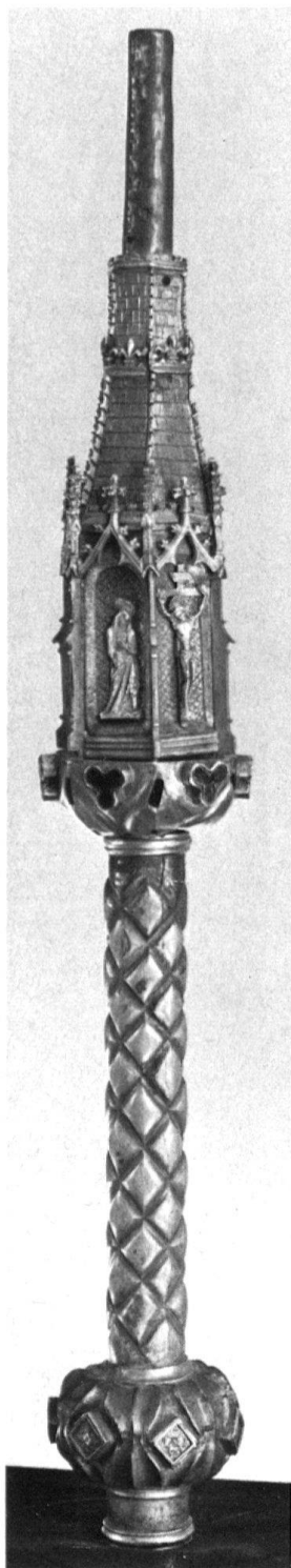
1 Pointe d'un bâton de chantre du 15 e siècle, venant vraisemblablement de la collégiale de Neuchâtel. Argent et laiton doré avec des émaux. Neuchâtel, Musée d'art et d'histoire.