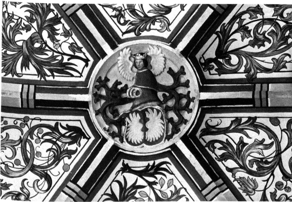
4 Hagenwil, Pfarrkirche St. Johann Baptist. Detail des Gewölbes mit neugefasstem Schlussstein.

sers Pauluskirche in Basel inspirierte Zentralbau in einer Formendurchdringung von Neuromantik und Jugendstil erhielt eine qualitätvolle Jugendstilausstattung, die in der Spannung der buntbemalten Holzteile, der fein ornamentierten und zart gefärbelten Wände und des rohen Steinmaterials der Kanzelwand besonders reizvoll ist.