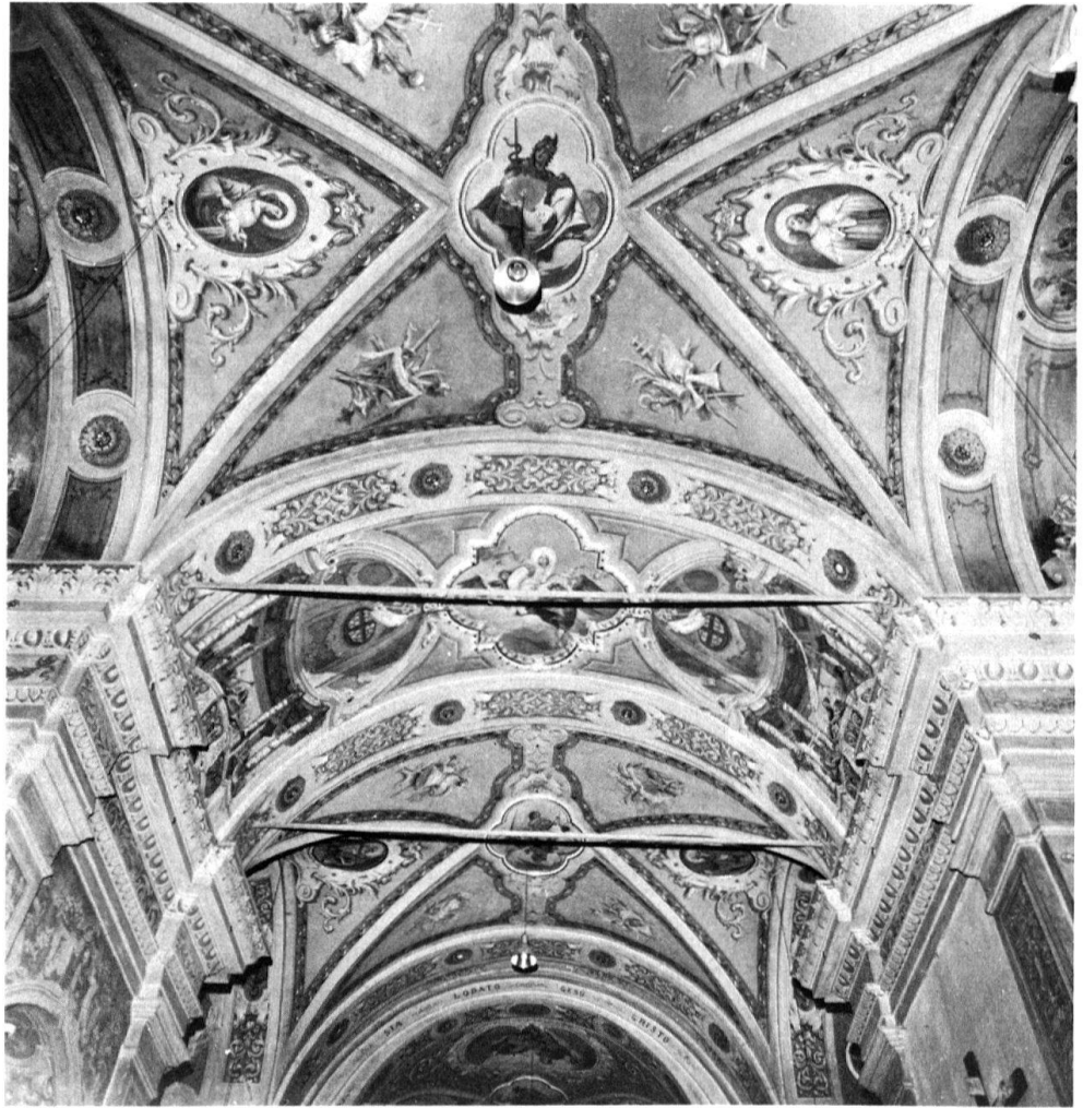
1 Gordevio, SS. Giacomo e Filippo. Vista d'insieme delle volte verso oriente.

canto ad un ricco programma iconografico, anche le pitture decorative, così come a Losone, in San Rocco (1860), o nella più vasta delle sue opere: gli affreschi della chiesa di San Bartolomeo ad Aurigeno (1866). In alcuni casi il Vanoni si avvale dell'aiuto di colleghi, come per esempio a Intragna (1859) dove lo accompagnano, nella grandiosa decorazione delle volte di San Gottardo, Giacomo Pedrazzi di Cerentino e Agostino Balestra di Gerra Gambarogno 3 . Nel 1863, in San Bernardo a Contra il Vanoni è forse ancora coadiuvato dal Balestra 4 ; nel 1874 i due, ma più probabilmente aiuti di bottega, sono attivi in Santa Maria Lauretana a Brione s. Minusio 5 . Ancora col Balestra troviamo il nostro a Cavigliano, in San Michele, nel 1875 6 .