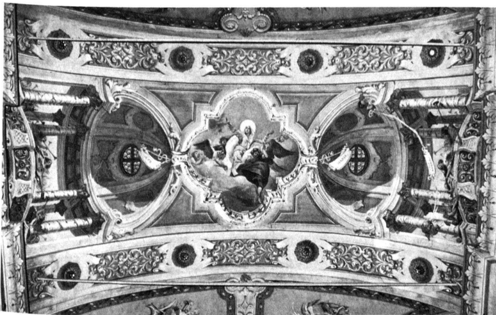
2 Gordevio, SS. Giacomo e Filippo. Particolare della decorazione delle volte: architetture illusionistiche e Assunta di G. A. Vanoni, 1853/54.