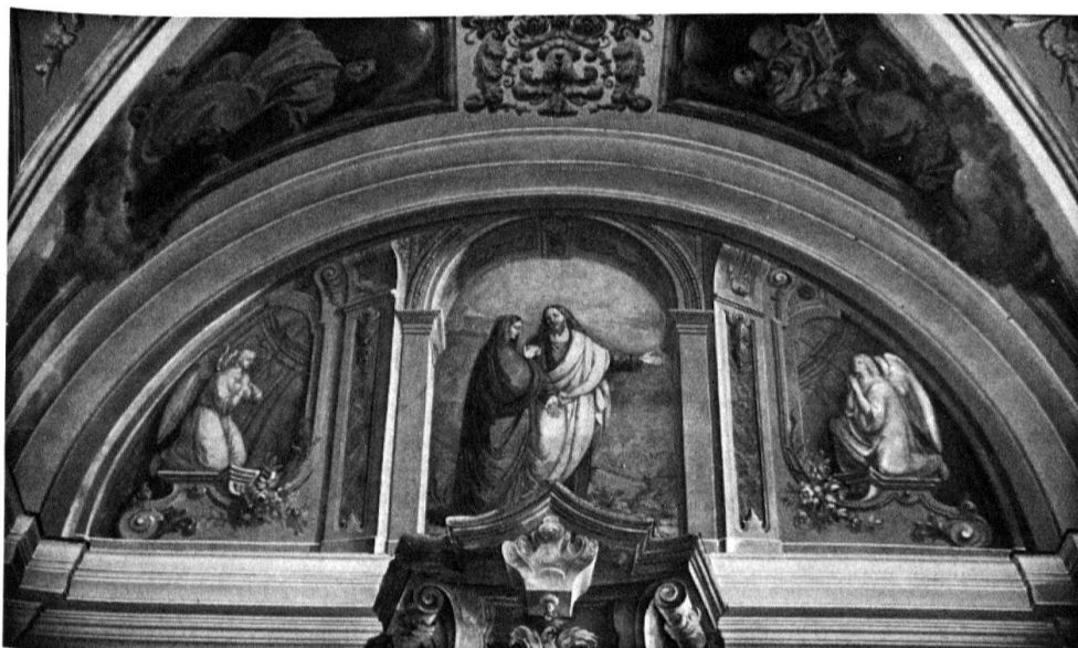
3 Intragna, S. Gottardo. Lunetta sulla parete di fondo, 1859.