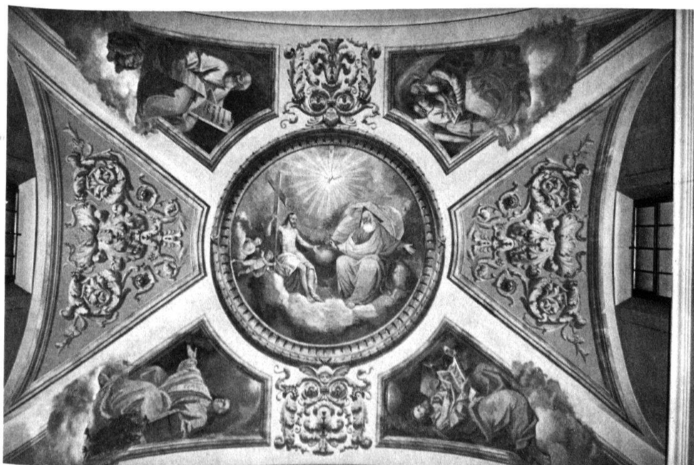
4 Intragna, S. Gottardo. Volta del presbiterio, 1859.