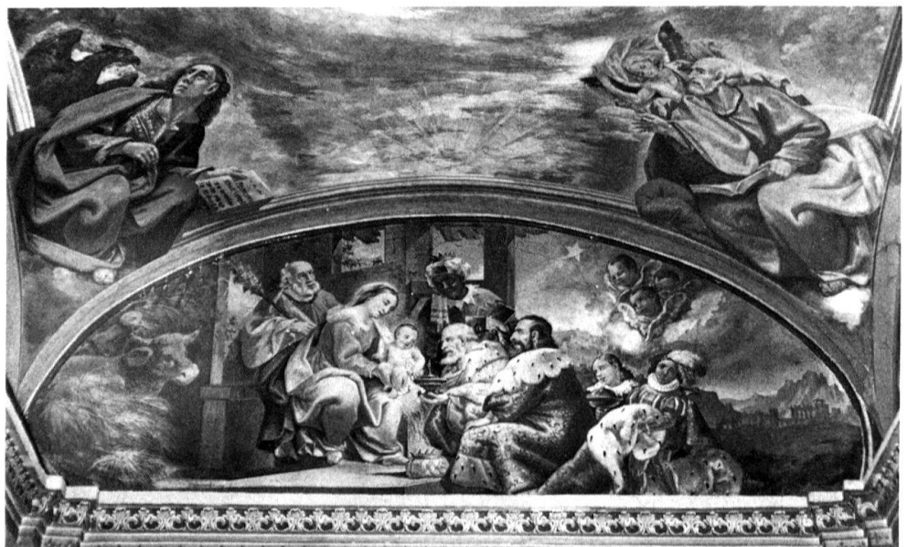
7 Contra, S. Bernardo. Lunetta sulla parete di fondo: Adorazione dei Magi. G. A. Vanoni, 1863.