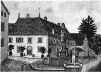
2 Maison de la Cousine Rosalie à Landzer, aquarelle miniature, Musée de Porrentruy.

à plus d'un titre, comme on l'a vu, Schirmer s'occupait également d'histoire plus récente. Ainsi, on connaît de lui une série d'aquarelles représentant les costumes jurassiens, copiés d'après Bandinelli, qui avait exécuté les originaux entre 1780 et 1795. Cette série atteste l'intérêt de Schirmer pour les sujets folkloriques dont il ressentait peut-être à la fois la profondeur et la fragilité. Par cet aspect de son œuvre et de sa sensibilité, Schirmer appartient au courant qui, dans la seconde moitié du XIX e siècle, en Suisse et en Europe, s'est efforcé d'élaborer une iconographie et une mythologie axées autour d'un sentiment national naissant.