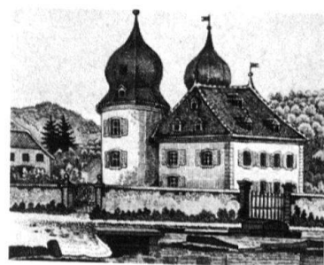
1 Le Château de Fontenais, aquarelle miniature, Musée de Porrentruy.

En parcourant l'œuvre de Schirmer, une seconde caractéristique se dégage, que l'on pourrait appeler le «sentiment national». Bien que né en France, de famille alsacienne, Schirmer semble s'être particulièrement intéressé à l'histoire jurassienne. Si l'antiquité l'attirait