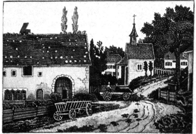
Vieille maison à Courtemautruy, près du Grenier des Templiers cl. aut. 1880

Porrentruy dans les années 1870 ainsi que de nombreux bâtiments ruraux aujourd'hui fortement modifiés, endommagés ou détruits.