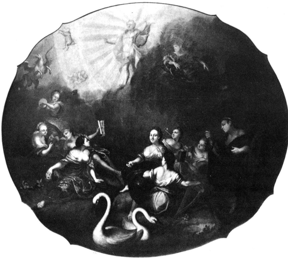
2 Schaffhausen, Haus zum Glas. Deckenbild von J.U.Schnetzler, 1750.

terordnet sich jedoch der durchsonnten Erscheinung Apollos. Auffallend am gemalten Gesamtwerk Schnetzlers ist, dass er sich des Themas von Apollo und den Musen gleich dreimal angenommen hat. Was mag ihn dazu bewogen haben? War es das Thema, das ihn besonders faszinierte, waren es ökonomische Gründe, die ihn dazu veranlassten, das erste Bild im Vorderen Stokarberg mehrfach wiederholend abzuändern?