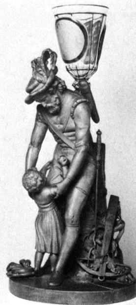
4 Sculpture en bois représentant Guillaume Tell et son fils, par Alexandre Trippel, remise en 1782 à la Société helvétique à Olten. Hauteur du personnage: 47,5 cm. Le verre a été remplacé en 1830. Musée national suisse, IN 70.

Créer un musée, c'est lancer un défi au temps qui passe. Cette préoccupation rejoint celle de Louis-François Guiguer de Prangins qui, en tenant son journal il y a deux cents ans, voulait «donner une permanence à des traces légères dans la mémoire» 8 . Comme les écrits,