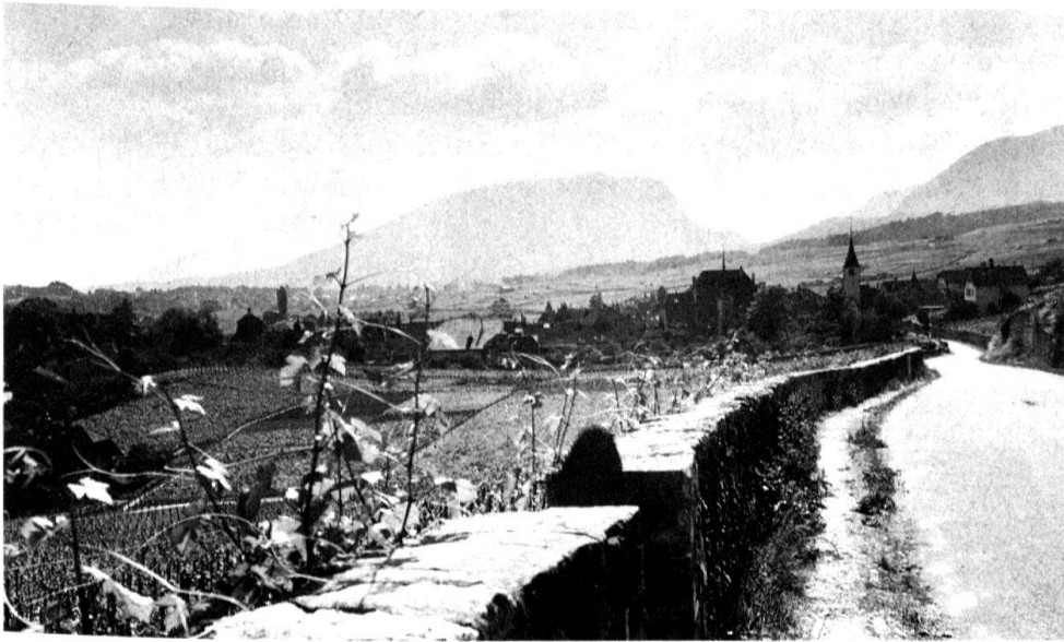
4 Auvernier NE, un site aujourd'hui bien compris malgré le décret neuchâtois.