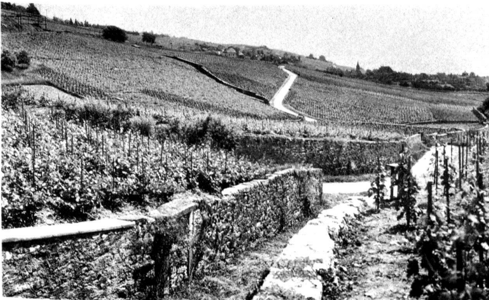
5 Auvernier NE, ... des chemins creux où les portes d'accès aux parcelles sont autant de petits chefs d'œuvre en voie de disparition.

l'homme n'a dominées que récemment, où les débordements du fleuve ont longtemps rebuté le cultivateur: peut-être auront-elles demain valeur historique?