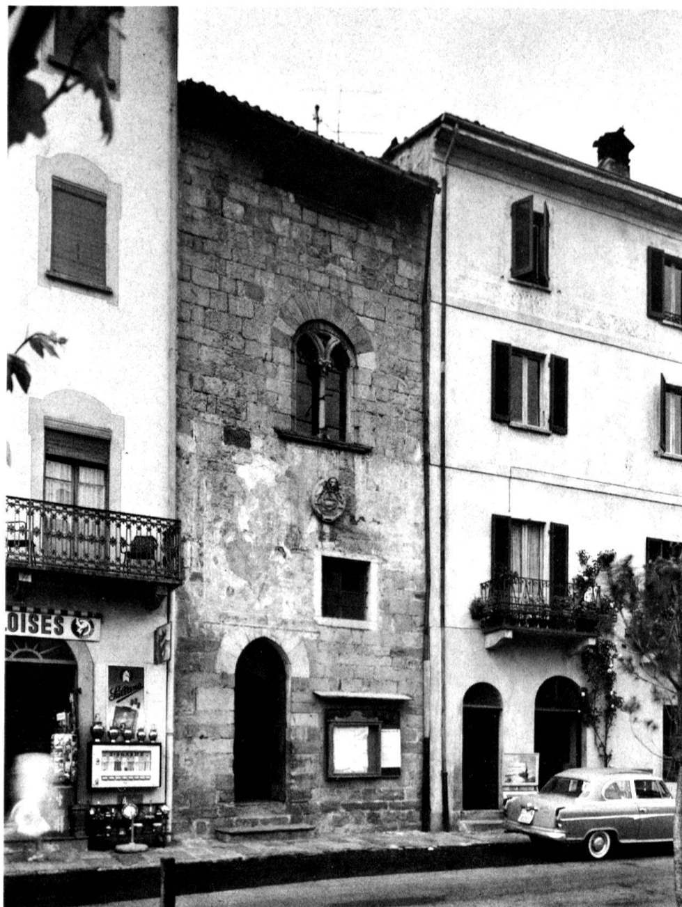
2 «Torre del Capitano», Morcote. Facciata al lago.

trata fino al pavimento del salone principale, il locale del corpo di guardia; al primo piano quello del Capitano (illuminato dalla bella bifora gotica), al quale si accedeva per una scala libera esterna sulla retrofacciata, e al piano superiore il posto di osservazione con probabili merlature e caditoie. La parte superiore della Torre fu demolita nel 1767 perché pericolante.