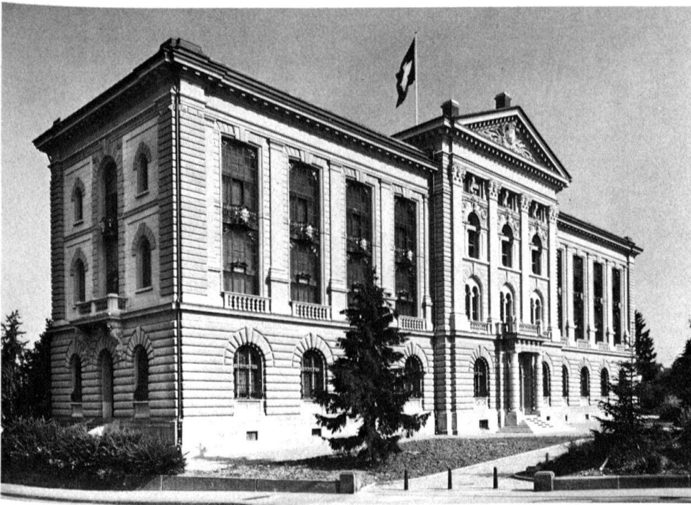
1 Bundesarchiv in Bern, erbaut 1897–1899, restauriert vom Amt für Bundesbauten 1981–1985.