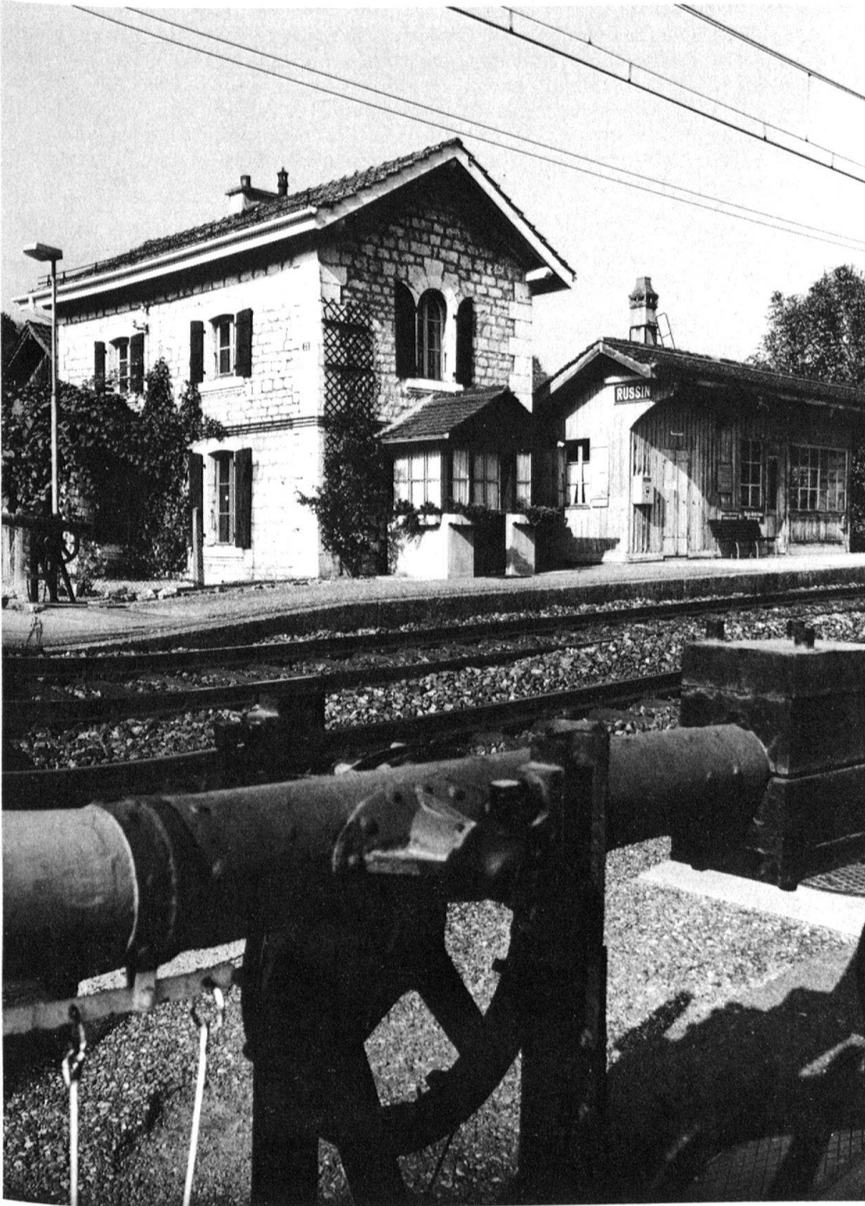
3 Russin, ein Bijou an der Linie Genf-La Plaine, eine der kleinsten Stationsanlagen, bestehend aus Wärterhaus (1858) und Wartehalle (1913).