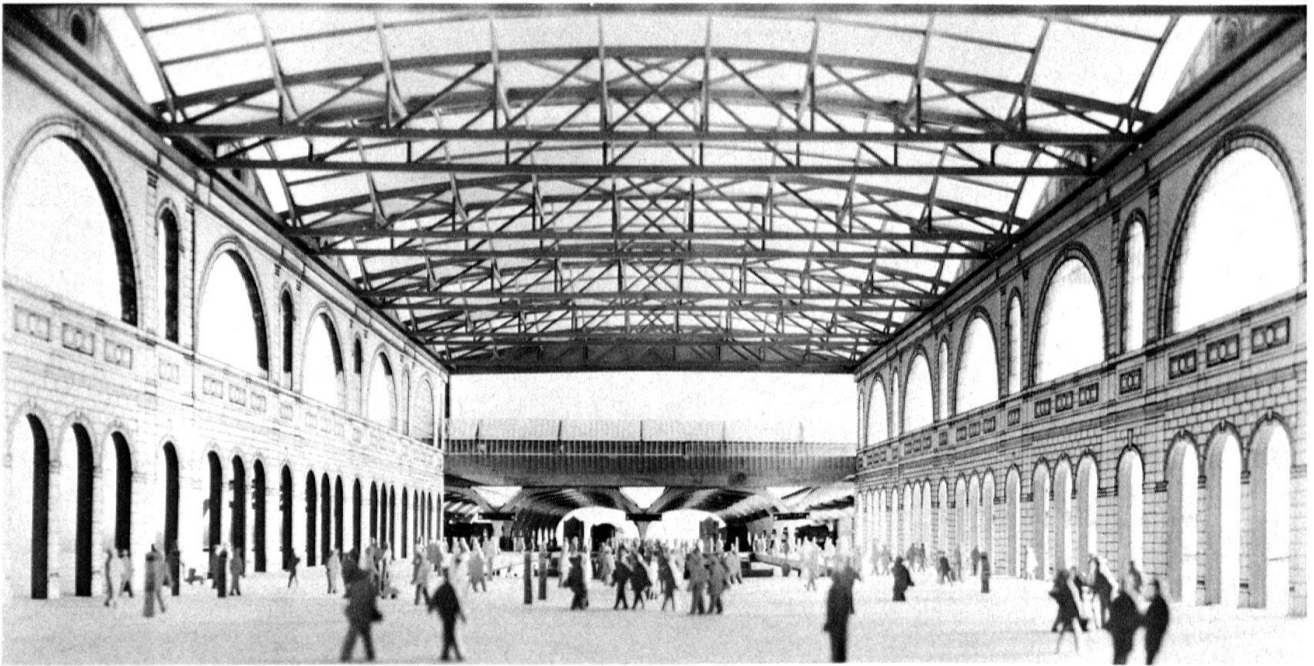
2 Die ehemalige Perronhalle im Hauptbahnhof Zürich, 1865–1871, von Architekt Jakob Friedrich Wanner, wurde 1980 restauriert und soll im Zuge der laufenden Erweiterung der Bahnhofanlage von allen störenden Einbauten befreit und dem reisenden und verweilenden Publikum zur Verfügung gestellt werden. Architekt Ralph Bänziger und Hochbaudienste SBB. (Modellfoto)

Seit gut zehn Jahren profilieren die SBB systematisch ein neues Erscheinungsbild als modernes, zuverlässiges, kunden- und umweltfreundliches Verkehrsunternehmen. Das betrifft z. B. die Gestaltung des Rollmaterials und der Uniformen, die Gebrauchsgrafik und nicht zuletzt das Bestreben nach hoher Qualität in der Architektur 4 . Hierzu steht in einer Weisung der Generaldirektion SBB zum Erscheinungsbild 5 als eine der verlangten Massnahmen: «Historische Bausubstanz schonen unter Berücksichtigung betrieblicher und kommerzieller Anforderungen».