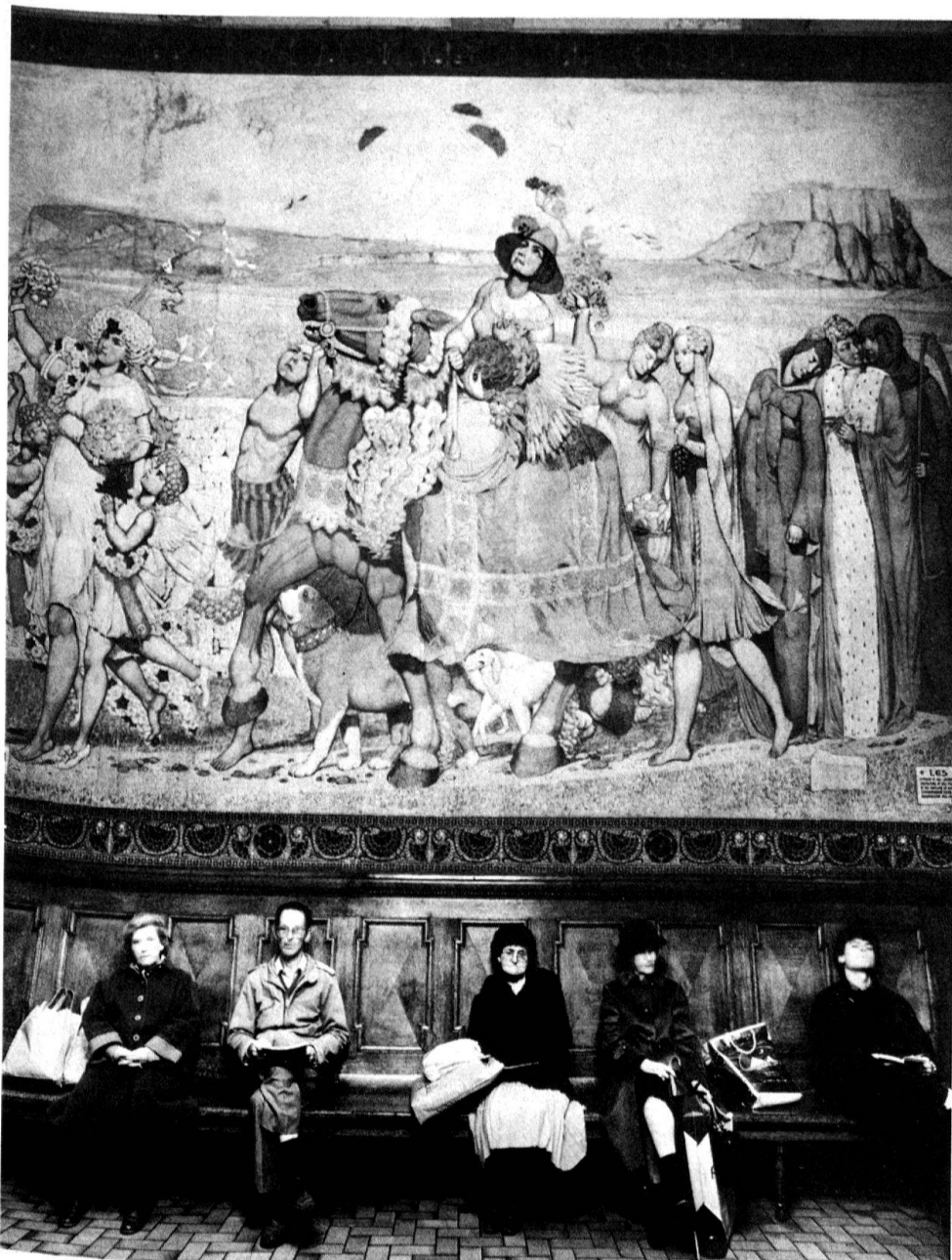
1 «Die Jahreszeiten» aus dem vierteiligen allegorischen Zyklus (neben «Studentanz», «Lebensalter», «Zeit und Ewigkeit»), 1923, von Philippe Robert, im Wartsaal 1. Klasse in Biel.

etwa drei Viertel noch aus dem 19., einige weitere aus dem frühen 20. Jahrhundert. Die allgemein zunehmende Wertschätzung der Kultur jener Zeit stellte die SBB wie die Privatbahnen fast unvermittelt vor die Verantwortung für eine grosse Zahl von schützenswerten Bauten und auch Werken der Plastik und der Malerei. Die SBB markierten 1974 die Wende zum neuen Verständnis durch den Entschluss, das Aufnahmegebäude des Zürcher Hauptbahnhofes nicht einer Neu-Überbauung zu opfern.