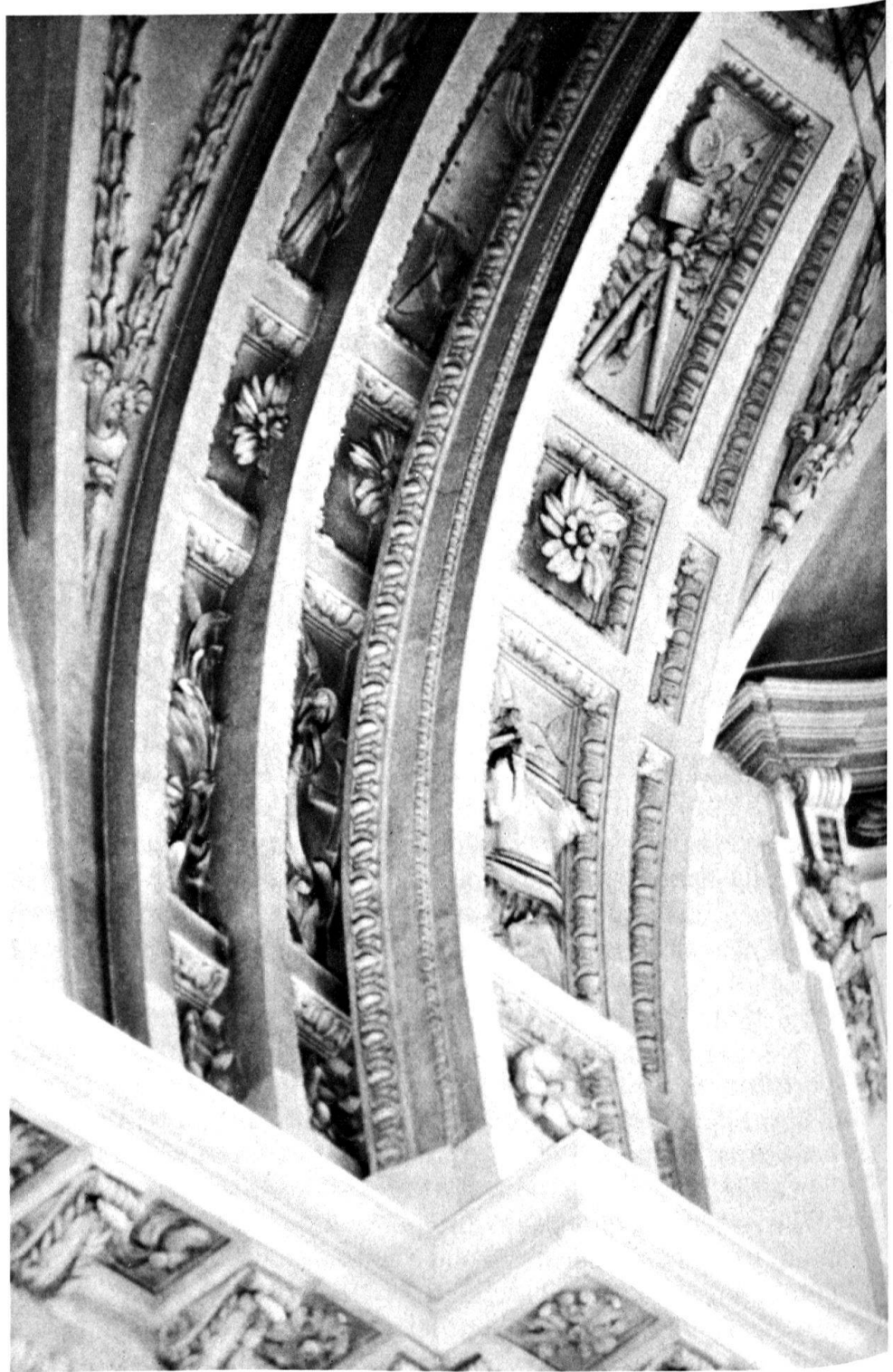
5 Soletta, cattedrale di Sant'Orso, particolare degli stucchi nel transetto, bottega dei Pozzi, fine anni sessanta.

III.5 Nel 1768, dopo anni di indecisioni, i Pozzi, preferiti a Feuchtmayer, iniziano i lavori per l'impianto decorativo all'interno della cattedrale di Sant'Orso a Soletta, lavori che li occuperanno per due anni con delle ulteriori riprese più tardive; infatti nel 1789 Carlo Luca esegue la gloriola dell'abside, ultima inserzione di stampo ancora barocco in una costruzione che, per volere dell'architetto asconese Gaetano Matteo Pisoni, costituisce un ritorno alla tradizione classica e l'inizio di un nuovo periodo storico-artistico 20 . La decorazione a stucco, nel nuovo modo di adattarsi alle strutture architettoniche, nei motivi