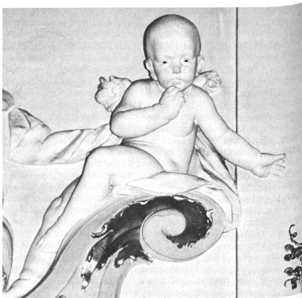
1 Ehingen, chiesa parrocchiale San Biagio, putto nel coro, attribuito ai Pozzi, circa 1754-58.

cenni che va dall'inizio degli anni '30 alla fine degli anni '70 del secolo. Parallelamente si nota un cambiamento di stile che si fisserà tuttavia nel sesto decennio del '700 in alcune particolarità e costanti. I vari momenti dello sviluppo seguono abbastanza fedelmente i mutamenti di gusto e l'evoluzione stessa della decorazione a stucco rococò, la quale, dopo le prime ed essenziali influenze francesi ancora legate ad una certa simmetria e ad un plasticismo contenuto, conosce un notevole impulso innovatorio verso l'asimmetria e la libertà compositiva della rocaille, dove le lettere C e S dei cartocci prendono le forme più impensabili e dinamiche. Il secondo quarto del secolo rappresenta dunque in molte regioni della Germania meridionale un periodo di libera e pittoresca interpretazione in chiave tedesca del repertorio iconografico-formale offerto dallo stile « régence » francese 9 .