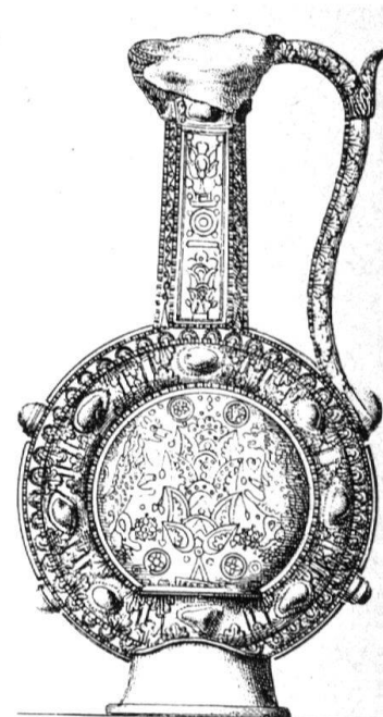
1 Dessin de Balvignac, Jean-Daniel: Histoire de l'architecture sacrée, Lausanne 1853, vol. 1., pl. XV. (pl. XVI: aiguière de profil)