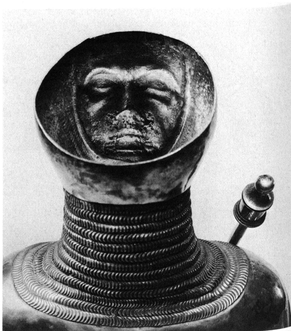
4 Buste reliquaire de saint Victor vu de dos, XV e siècle, trésor de l'abbaye de Saint-Maurice: aspects inattendus: le photographe joue-t-il avec l'objet – ou l'œuvre se joue-t-elle du spectateur?

l'aiguière, compose ses planches avec plusieurs points de vue d'une même partie de la pièce, ce qui permet de la saisir à la fois dans son ensemble et de manière fragmentaire.