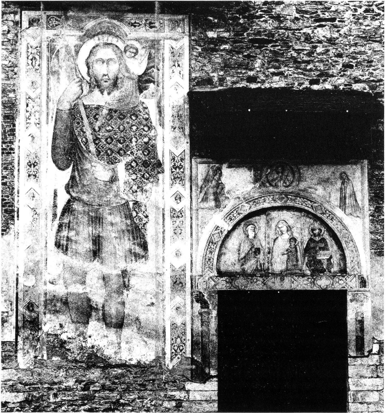
2 «Maestro di S. Biagio», Fassadenfresko, Ravecchia, S. Biagio.

zelne illuminierte Manuskripte 3 . Herausragende Künstlerpersönlichkeiten mit klarem Profil und richtungsweisende «Capi Scuola» wie in Florenz und Siena fehlen in der Lombardei des 14. Jahrhunderts fast gänzlich. Einzig mit dem Meister des Fissiraga-Grabmals in der Franziskanerkirche von Lodi und dem namentlich unbekanntem « Maestro di S. Abondio », die in der Gegend von Como, Varese und Mendrisio verschiedene Freskenzyklen hinterlassen haben, kann zumindest in der Gegend von Como im frühen Trecento eine stilistisch zusammenhängende Tradition festgestellt werden 4 ; doch von einer recht eigentlichen comaskischen Malerschule kann kaum die Rede sein.