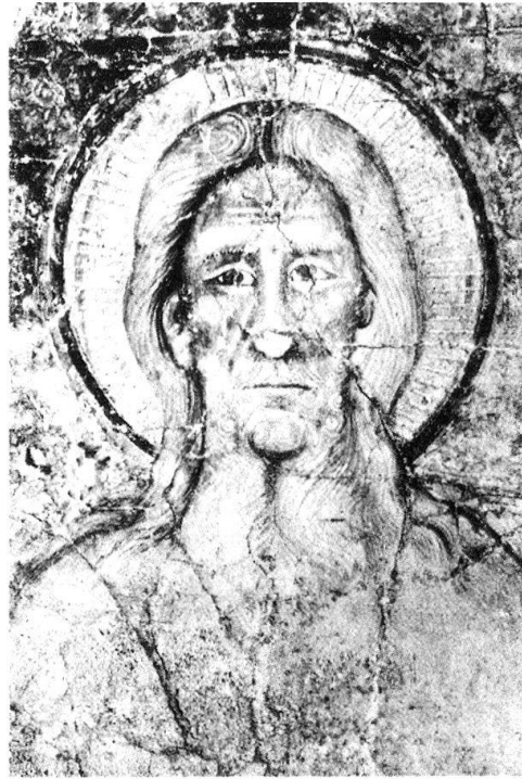
7 «Maestro di S. Biagio», Christus (Ausschnitt), Ravecchia, S. Biagio.