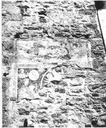
1 Vue d'ensemble de la peinture murale sur la tour de l'église paroissiale St-Martin à Ilanz.

La fresque extérieure sur la tour de l'église St-Martin à Ilanz, n'est plus, aujourd'hui, qu'un fragment mutilé. Elle dévoile cependant une iconographie originale et un contenu théologique complexe. En illustrant un moment clef de la vie d'un saint, cette peinture murale jette une lumière sur toute une conjoncture politique et ecclésiastique des Grisons au 15 e siècle. Exposée non seulement à la vue des fidèles, mais à celle de tous les passants, elle doit être considérée comme un vrai «monument public».