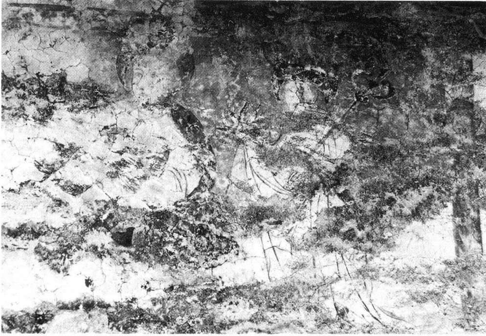
3 Partie supérieure de la peinture murale sur la tour de St-Martin à Illanz. Etat actuel.