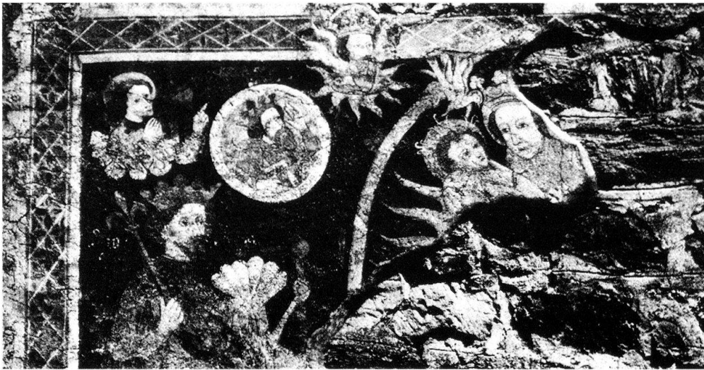
2 Partie inférieure de la peinture murale sur la tour de St-Martin à Ilanz. Photo prise par Erwin Poeschel avant 1942.

ronnée et nimbée, enveloppée d'une cape volumineuse. Elle tient dans une main un brasier enflammé et, dans l'autre, un sceptre fleurdelisé. Devant elle, dans un premier plan, se dessine la stature imposante d'un autre personnage. Nimbé lui aussi, il porte une couronne sur ses cheveux courts. Son visage imberbe, aux traits finement ciselés, ne permet pas de décider s'il s'agit d'un homme ou d'une femme.