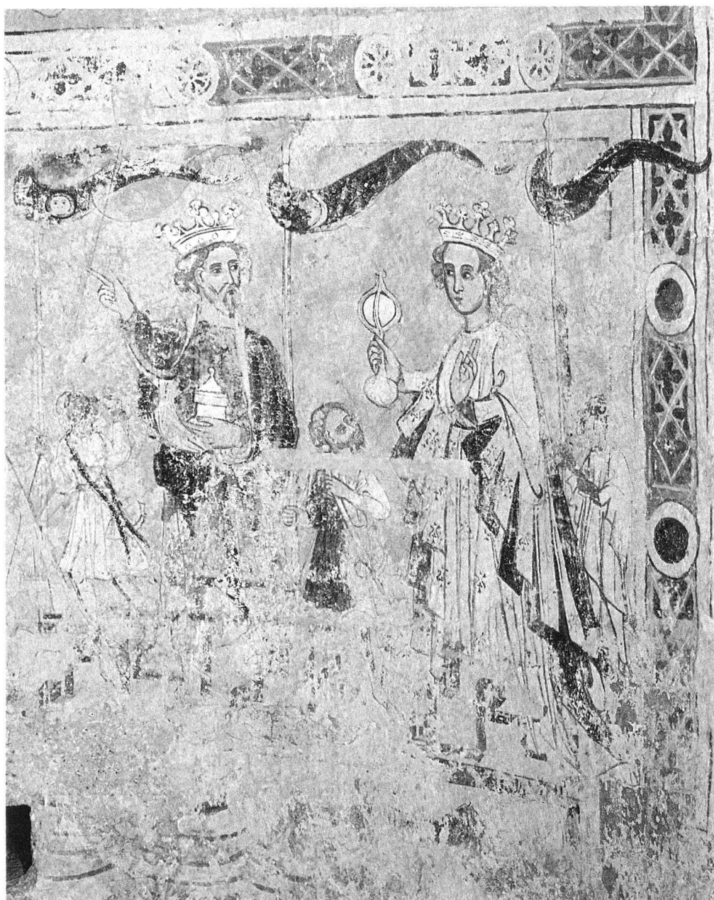
5 Peinture murale de l'ancienne église du couvent St-Pierre à Mistail. Les Rois de l'Épiphanie et le motif décoratif.