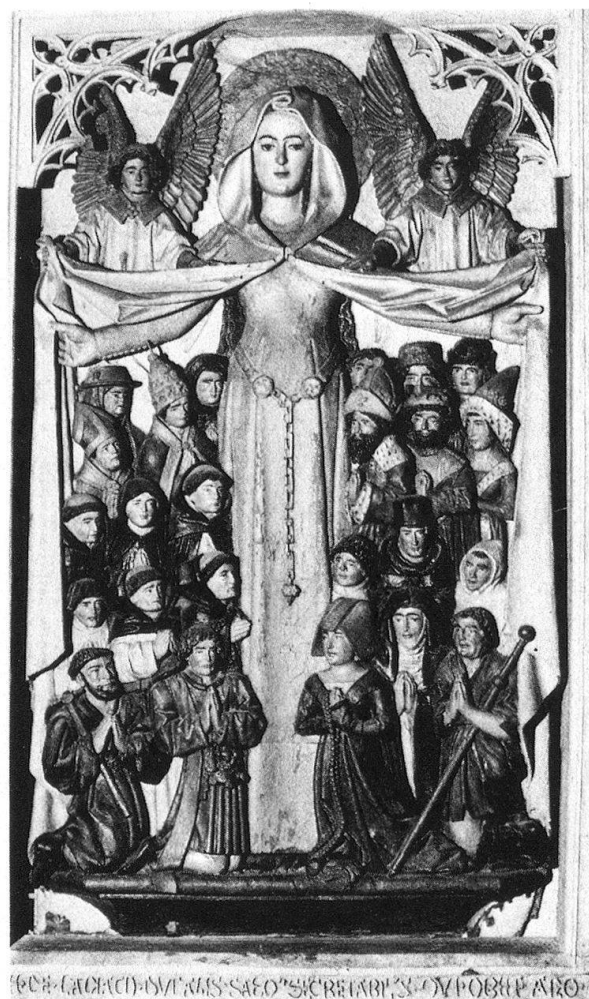
4 Eglise de Lagnieu (vers 1471): partie centrale du retable autrefois conservé dans la chapelle de la Croix.