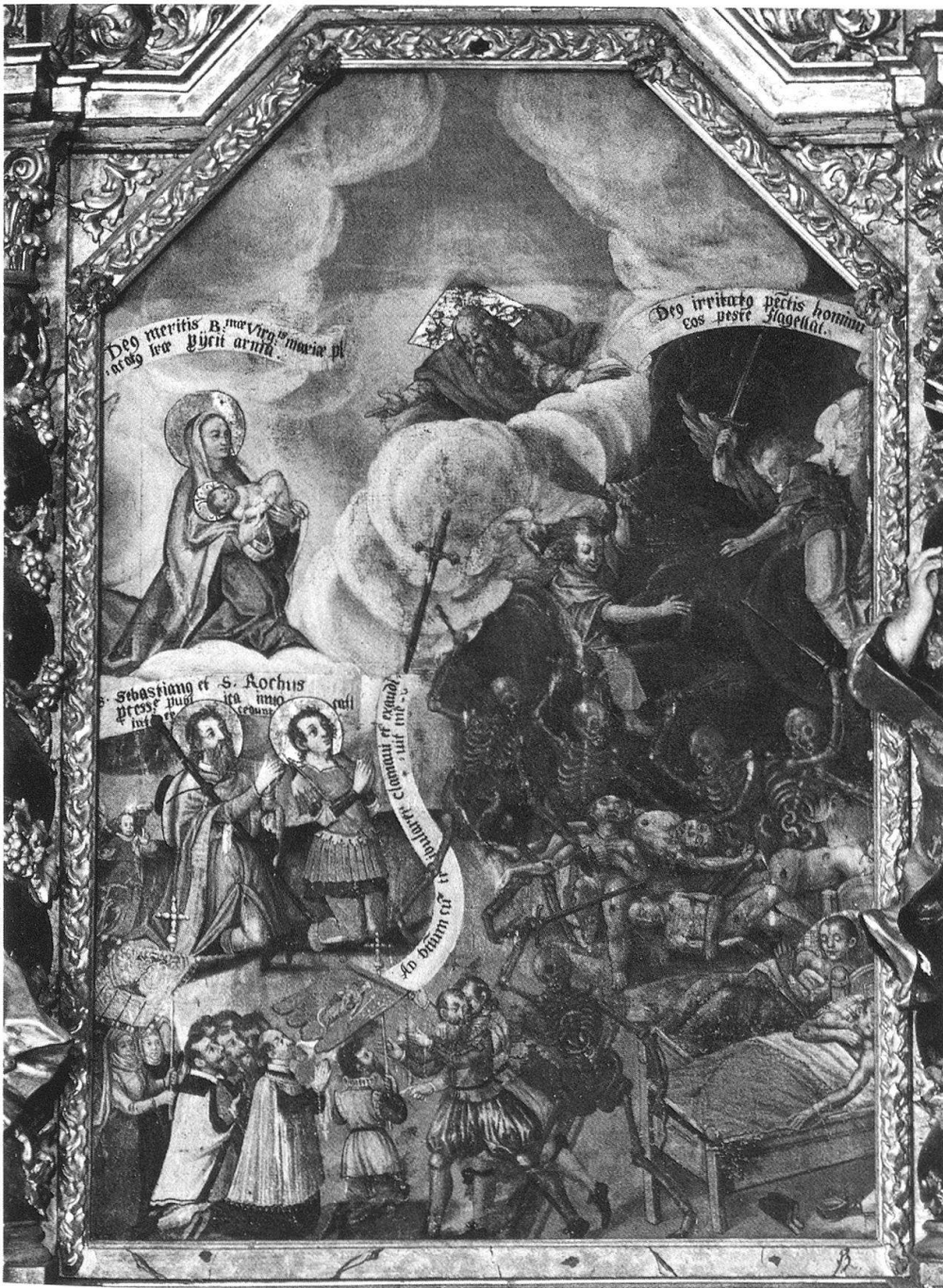
4 Altarbild des südlichen Seitenaltares der Kapelle St. Sebastian in Igels/Degen, Graubünden; ca. 1630.