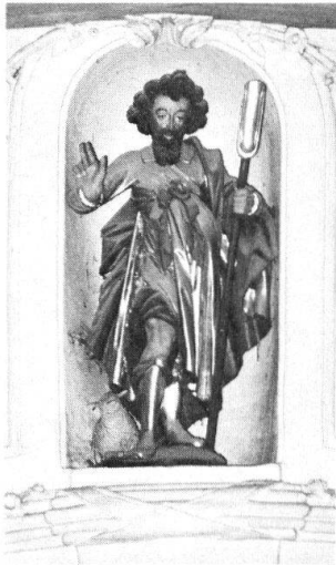
3 Holzgeschnitzte Statue des hl. Wendelin in der Nische über dem Chorbogen, vermutlich das Geschenk des Landvogts und Grossrates Wendel Ludwig Schumacher.

grund stand und nicht die Qualität der Glasmaler-Arbeit. Eine Episode beim Kirchenbau Greppen bietet einen Gegenbeleg. Die «Pursumme von Greppen» nämlich kritisierte die Arbeit der Luzerner Glasmaler. Die Schwyzer gaben den Greppern recht, und die Luzerner mussten darauf an ihren Arbeiten Verbesserungen vornehmen. Allerdings entbrannte in dieser Handwerksbranche ein heftiger Streit. Die Luzerner Regierung verwies die Angelegenheit an die St. Lukasbruderschaft. Darüber, wie der Zwist in dieser Zunft beigelegt wurde, fehlen die Quellen 21 .