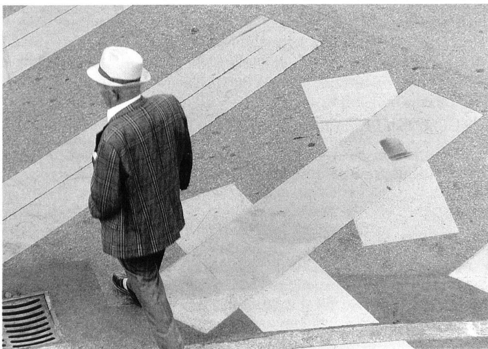
1 Ueli Berger. Fussgängerskulptur an der 8. Schweizer Plastikausstellung 1986 in Biel.

Die Weichen zur Entwicklung der modernen und derzeitigen Stadt wurden an der Schwelle vom 18. zum 19. Jahrhundert gestellt. Aufklärung, die politischen Umwälzungen und der spätere Liberalismus als überörtliche und grossenteils auch transnationale Kulturerscheinungen überführten Stadt in neue politische, wirtschaftliche, gesellschaftliche, kulturelle und damit auch in neue räumlich-architektonische Bezugsfelder. In einem raschen Prozess setzten die Französische Revolution und deren Folgen den alten republikanischen Stadtordnungen und städtischen Vorherrschaften (gegenüber der Landschaft) ein Ende. Das Fallen restriktiver Zunft- und Rechtsordnungen sowie die Einführung von Niederlassungs-, Handels- und Gewerbe-freiheiten führten – unterstützt durch die Industrialisierung und Bevölkerungszunahme – seit der ersten Hälfte des 19. Jahrhunderts zu grossen Binnenwanderungen und dadurch auch zu neuen Formen