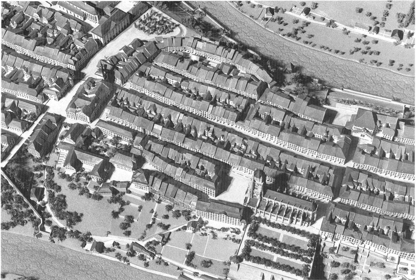
4 Berne vers 1800: l'aire de la première extension, vue du sud.

née 9 . Ces maquettes se fondent sur des documents contrôlés; elles contiennent cependant une part conjecturale, puisque l'idée d'un état complet et certain est absurde: impossible de saisir l'ensemble d'une ville à un moment précis du passé; on a toujours affaire à une approximation. Laquelle peut varier de beaucoup: la grande maquette de la Rome constantinienne, à l'EUR, est largement hypothétique en ce qui concerne les zones d'habitation tandis que le modèle de Rorschach à la fin du XVIII e siècle, qui transcrit un plan de 1790 et une vue à vol d'oiseau publiée quatre ans plus tard, possède un enviable degré de vraisemblance historique.