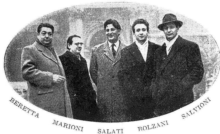
8 Il gruppo dei «Pittori della Barca», 1952.

animosa. Inutile dire che nessun angelo prestò ascolto a quel desiderio, che l'impresa di Comologno non trovò molti imitatori... Toccò ancora una volta alla gente di lassù, agli «Amici di Comologno», tornare alla carica e riprendere l'animoso discorso...».