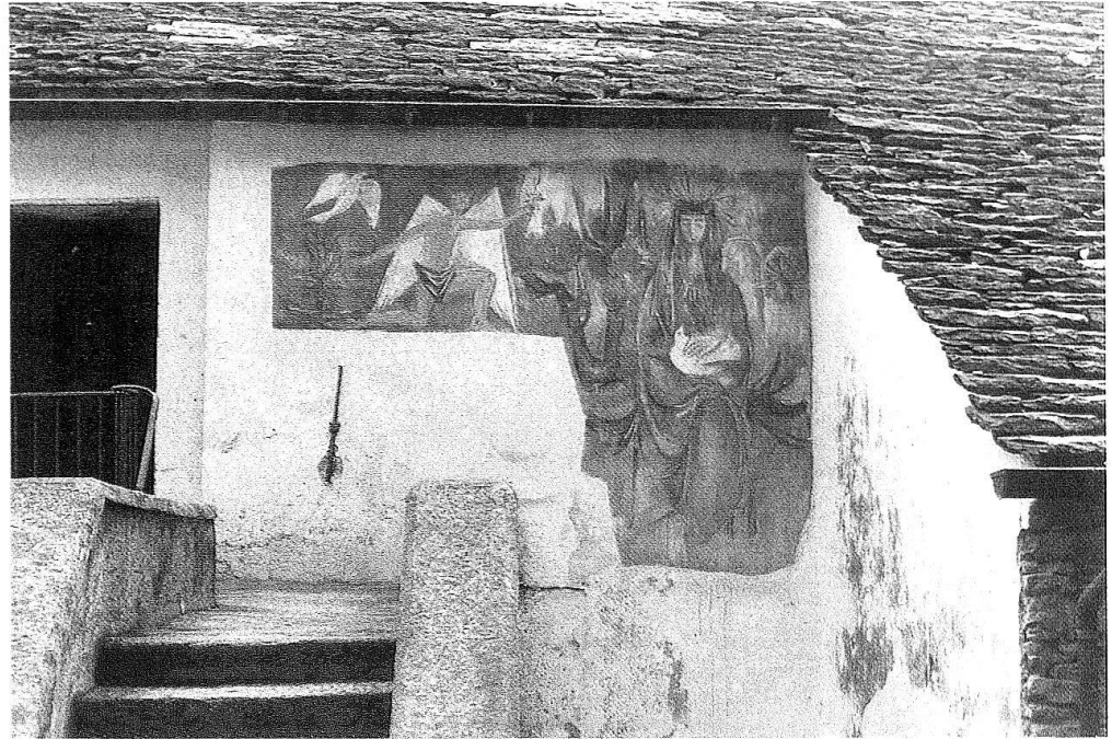
6 Comolugno, Chiesa parrocchiale. L'Annunciazione di Sergio Emery. 1966.