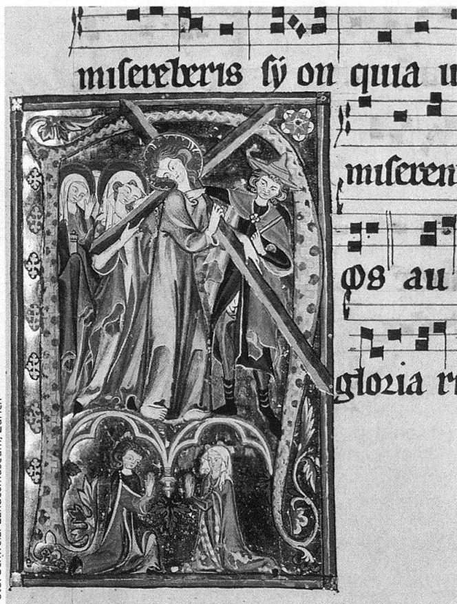
Schweizerisches Landesmuseum Zürich. Graduale, vollendet 1312. Fol. 90r, Initiale N, Kreuztragung Christi.

zuordnen. Die hochgotischen, literarisch gut bezeugten Werke der Wand- und Glasmalerei sind Opfer der Zeit und der Barockisierung geworden. Noch aber bewundern wir unter anderem das, wie das meiste, abgewanderte grosse, auf Pergament gemalte Altarkreuz von 1250/1270 oder in der Buchmalerei zwei einzigartig reich bedachte Spitzenwerke, die Gradualia von Nürnberg (Ende des 13. Jahrhunderts) und das 1312 vollendete im Schweizerischen Landesmuseum Zürich. Diese noch an der Schwelle der Gotik stehenden, wesentlich von Nordostfrankreich und dem Oberrhein befruchteten Kunstwerke erlauben eine Entwicklung nachzuzeichnen, die parallel jener der Mystik verlaufen ist: von einer herberen, körperlich noch betonten Darstellungsweise zu einer schwerelosen, weich melodienseligen und bis zu einem immer formelhafter werdenden Ausklang. Auch im 15. Jahrhundert entstanden Werke von zum Teil aufregender Qualität. So eine Dreikönigsgruppe aus dem ersten Viertel des Jahrhunderts, deren Alabaster die originale Farbfassung bewahrt hat, sodann als Goldschmiedearbeit edelster Art das Haupt des Johannes Baptist, für welches Werk der Jahrhundertmitte die Herkunft nicht völlig zu klären war, an Tafelmalerei z. B. Al-