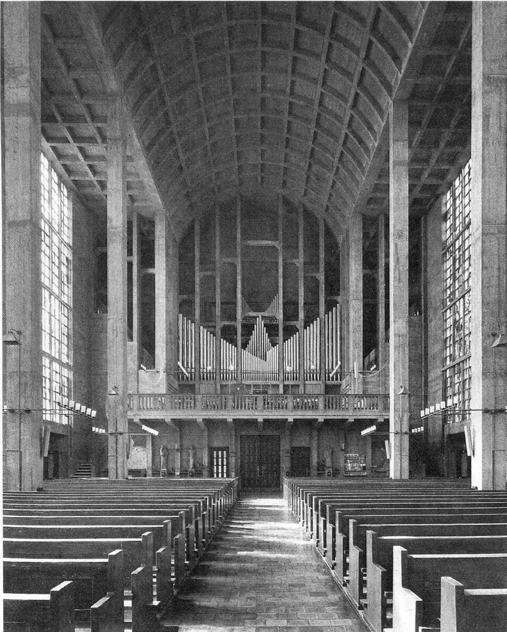
1 Basel, St. Antonius, Inneres gegen die Orgel. Architekt Karl Moser 1925–27.