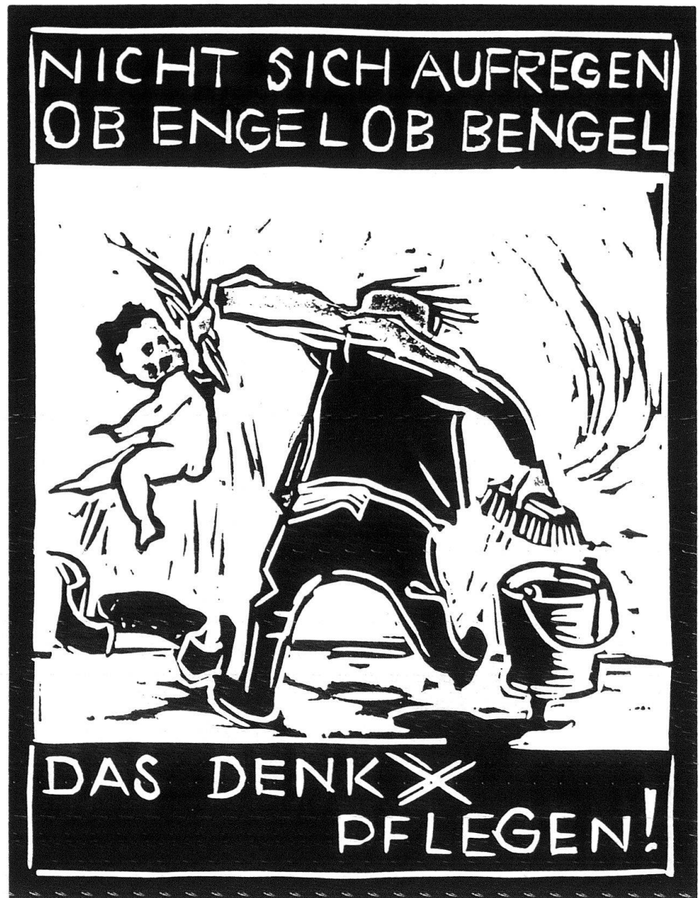
4 Albert Knoepfli. Neujahrskarte 1965. Linolschnitt.

Der unerbittliche Kampf gegen den Ungeist in der Hülle des Denkmals – gegen alles Verstiegene, Gestelzte, Gespreizte und Erstarrete – wurde während Jahrzehnten von einer unerschrockenen Elite als gute Sache vorgetragen. Dem galt die ungeteilte Sympathie der kleinen Schar Gleichgesinnter und der verhaltene Beifall oder das Pfeifkonzert der unbekannteren Menge. Ob sich daran etwas geändert hat? 1975, das Europäische Jahr für Heimatschutz und Denkmalpflege, sollte die Denkmäler einer breiten Öffentlichkeit näherbringen. Wie es scheint, ist das geglückt – und doch misslungen 6 . Die Propagierung denkmalpflegerischer Grundsätze hat zweifellos Massen mobilisiert. Aber sie hat auch ausgelöst, was kein Kunsthistoriker und Denkmalpfleger beabsichtigt haben kann: den Missbrauch der Denkmäler für eine monumentale Entsorgungs-Ästhetik. Nun hat die alles verzehrende Konsumitis ihren ästhetischen Kanon in stilrei-