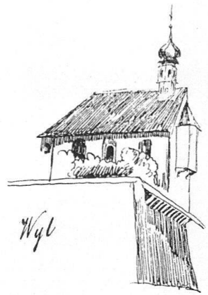
1 Johann Georg Müller (1822–1849). Die ehemalige Dienerschaftskapelle im «Hof», Wil. Aus dem Skizzenbuch, hrg. von J. M. Ziegler 1860.