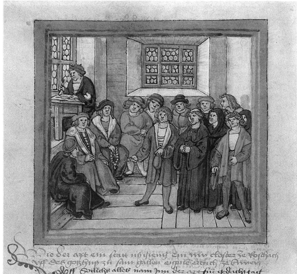
1 Ulrich Rösch verhandelt mit der St. Galler Bürgerschaft um die Wiederherstellung der zerstörten Klosteranlage in Rorschach (Bilderchronik von Diebold Schilling, 1513).

tionen und Privilegien. Dieses Ringen möchte ich im folgenden detaillierter an der Entwicklung der städtischen Münsterbaupflegschaft, den bürgerlichen Münsterstiftungen und an der Wallfahrt zu «Unserer Lieben Frau im Gatter» (1479–1485) aufzeigen, die parallel zum Bau der spätgotischen Choranlage des Münsters (1479–1483) entstanden war. Einleitend jedoch eine knappe Skizze der politischen Ereignisse, die dem religiösen Autonomiestreben St. Gallens ihr spezifisches Gepräge verliehen.