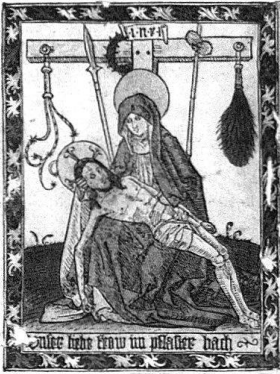
4 Wallfahrtsbildchen von Pflasterbach ZH, um 1505. Die schmerzhaftes Muttergottes (Vesperbild) trat im späten Mittelalter in den reichsnahen Gebieten wie St. Gallen, Aarau oder Riedertal an die Stelle von Maria als «Thron der Weisheit», die im Mittelpunkt der hochmittelalterlichen Wallfahrtszentren Unserer Lieben Frau stand.

tierte er: «was er mit ainen züg verdienen möcht, das wolt [er] vnser lieben frowen geben an den büw. Do hat er verdienet sechs schilling pfennig [1482].» 64 Leider verfügen wir jedoch über keine mit Regensburg oder Altötting vergleichbaren Verzeichnisse der Fabrik- bzw. Wallfahrtseinkünfte 65 . Obschon diese nach den Wunderaufzeichnungen vorwiegend aus Wachs und Kleinvieh bestanden, dürften sie auch in St. Gallen wesentlich zur Mitfinanzierung der Choranlage beigetragen haben.