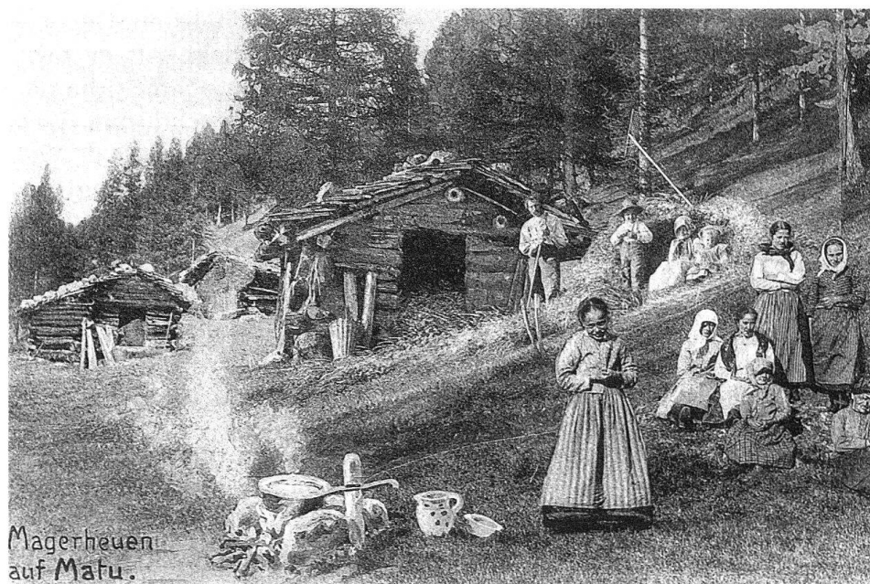
6 Magerheuen auf Matu, oberhalb von Masescha, um 1900.

dann in das gleiche Horn blasen, ehe sie die Sache selbst überlegen ...». Nach dem Abwägen des Pro und Contra in solchen gegensätzlichen Positionen ergab sich jedoch meistens eine einvernehmliche Lösung, die dann durchgesetzt werden konnte. Durch solch verantwortliches Handeln ist in den verflossenen Jahrhunderten der Walsergeschichte zum kulturellen Fortschritt der Gemeinde schon Beachtliches beigetragen worden, in jüngster Zeit auch der Bau des Dorfzentrums, das am 31. August 1980 eingeweiht wurde.