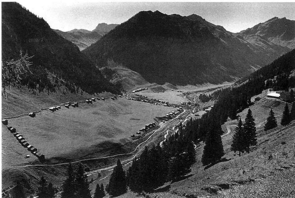
3 Saminatal und Kurhaus Sütca, ca. 1930. Hüttenreihen der beiden Genossenschaften im Steg.

sie auf der einen Seite «zähe am Alten hängen», auf der anderen Seite aber als talentvoll und weltoffen «nach Entwicklung und Fortschritt streben». Dazu sind sie ausgeprägte Individualisten. Dies hat ganz unbewusst ein Bauer auch religiös ausgedrückt. Als er Zwillingsbuben bekam, ging er zum Pfarrer und meldete ihm: «I ha daa zwee Buaba. Dr eina wil i für d Lüüt, där tuaschd mar guat ubarchrisma (fortschrittliches Element); discha ha n i nu für ds Vee, äna muaschd mar nu a bitz ubarbrudla!» (beharrendes Element).