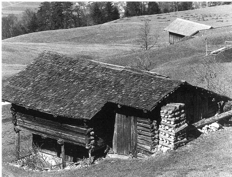
5 Stall im oberen Profatscheng, ein Weiler nördlich von Triesenberg gelegen, ca. 1940. Der Stall trägt über dem Eingang die Jahreszahl 1793.