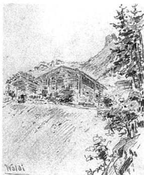
4 Altes Walserhaus «Waldi», unterhalb von Masescha, um 1890. Aufnahme nach einer Zeichnung von Peter Balzer, Triesenberg.