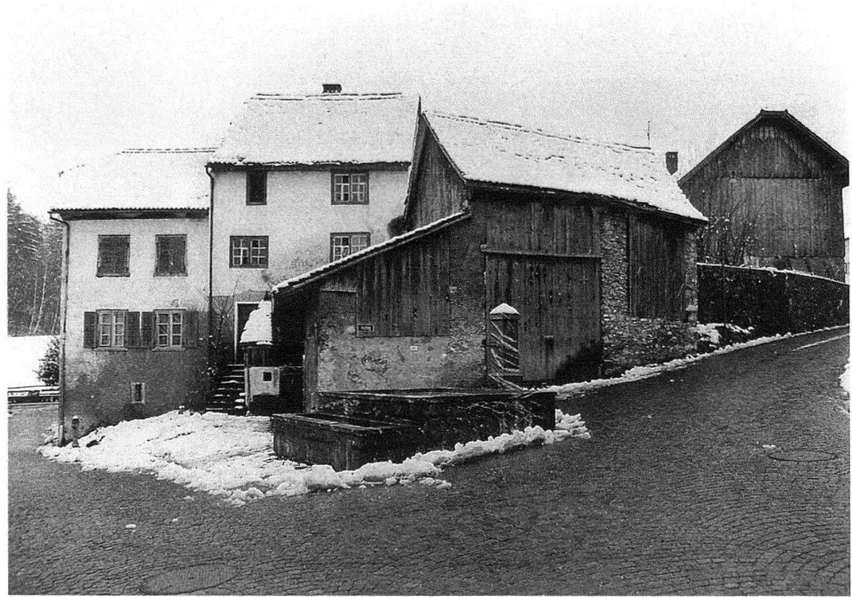
2 Balzers, Iradug 74 und 76, neuere Massivbauten, 1907 und 1841 mit Stallscheune, abbruchgefährdet.

mäuerchen, soweit ein Kellergeschoss fehlt. Öfters sind zudem die Blockbauwände in Anlehnung an Ständerbauten auf Schwellenkränze abgestellt; im frühen 16. Jahrhundert erscheinen Zwischenwände vorerst nur unregelmässig durchgezäpft, danach regelmässig. Massivmauerwerk tritt zu allen Zeiten auf, ohne wesentliche Charakter-Änderungen, gewinnt aber zunehmend an Bedeutung, wie ab barocker Zeit einzelne Holzwände durch Mauerwerk ersetzt werden. Seit Anfang des 19. Jahrhunderts und vor allem nach der Aufhebung des Bauverbotes 1848 werden nebst den unten beschriebenen Bautypen auch reine Massivbauten erstellt, noch immer unter Beibehaltung der hergebrachten Raumordnung Typ E. Fachwerk spielt hierzulande nur eine sehr unbedeutende Rolle im 18. und 19. Jahrhundert, wobei Ausfachungen bis 1840 mit Lehmwickeln verfüllt werden.