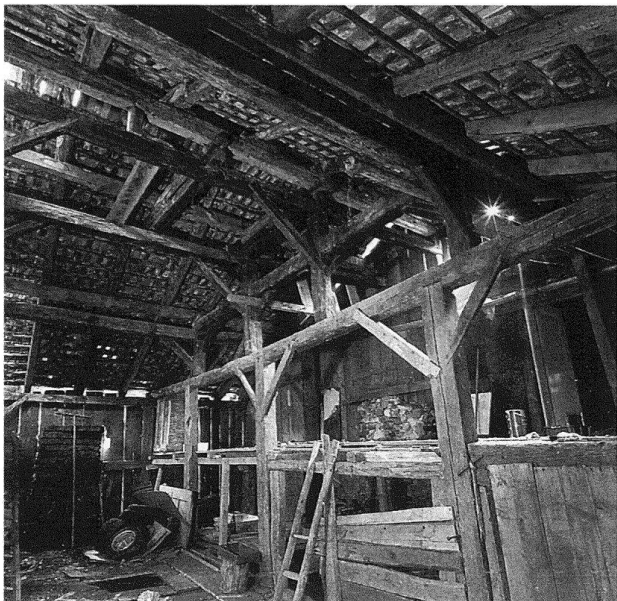
7 Triesen 46, Scheune 1714, abgebrochen.