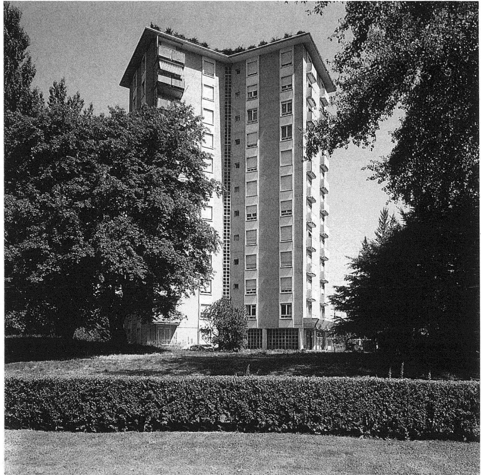
2 Zürich, Hochhaus «Im Gut», Karl Egender, 1953/54, Ansicht von Süd- westen.

hochgehende Renovationswelle anhält – in einem Jahrzehnt die meisten Bauten der Epoche unabhängig von ihrem denkmalpflegerischen Wert zerstört sein.