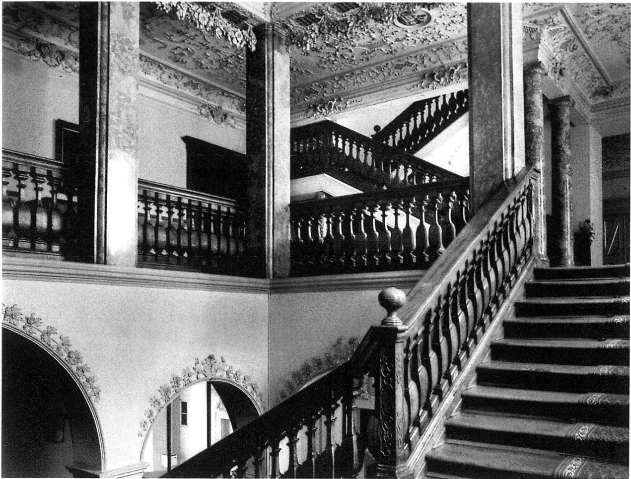
Bischöfliches Schloss Chur, Treppenhaus, 1731–1733. Blick vom zweiten Zwischenpodest zum diagonal nach hinten verschobenen Ausgang zum zweiten Obergeschoss.

Treppenteil ist an die rückwärtige Innenhofseite gerückt. Gegen die Hauptseite am Hofplatz zu gliedern sich repräsentative Bereiche an: im ersten Stock die Kanzlei, im zweiten der Bischöfliche Empfangsraum. Im Erdgeschoss führt eine breite, gewölbte Durchfahrt vom Hofplatz zum Innenhof. Von der Durchfahrt aus wird seitlich die gerade, dreiläufige Treppe zum ersten Obergeschoss betreten. Nach hinten, diagonal zum zweiten Zwischenpodest gerückt, erscheint als Fortsetzung eine zweiläufige, quergestellte Treppe mit Richtungswechsel. Sie mündet im zweiten Obergeschoss in den grossen Vorplatz vor dem Bischöflichen Empfangsraum. Die Stufen bestehen aus Eichenholz, die mit kräftigen, anschwellenden Balustern versehenen Geländer hauptsächlich aus Nussbaum. Der Bereich der ersten, grossen Treppe wird von drei Pilastern, der Aufstieg zur zweiten Treppe von zwei Säulen aus Stuckmarmor bezeichnet. Die gekehlten Flachdecken beider Geschosse weisen eine reiche Régence-Stukkatur auf, die in die Korridore des Nordtrakts und in die Kapelle und deren Vor-