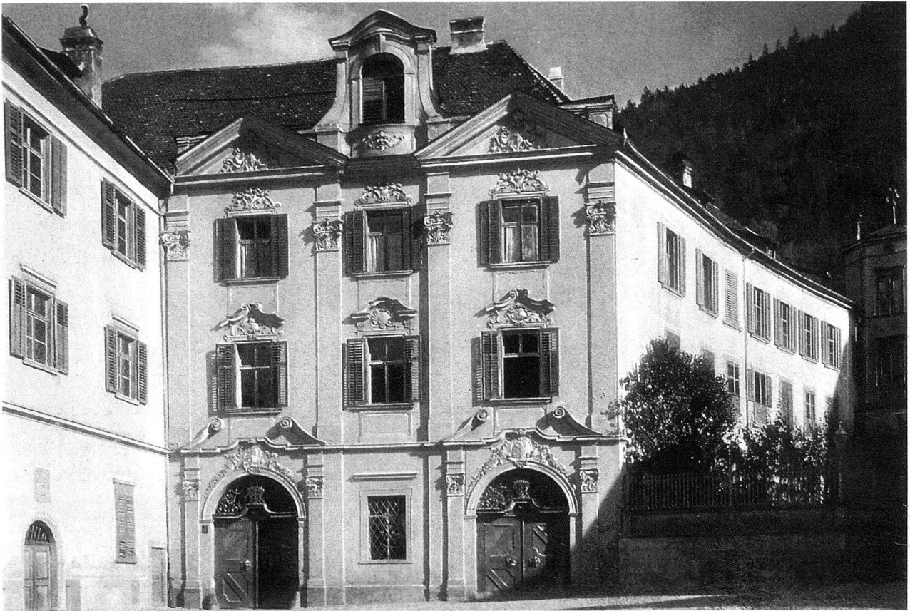
Eingangsfassade. Der mit seiner stuckierten Front auf den Hofplatz ausgerichtete Westtrakt ist zur Hauptsache Gehäuse für die zentrale Treppenanlage. Aufnahme vor der Restaurierung von 1963.

Kompositkapitellen in einen schmalen mittleren und breite äussere Bereiche gegliedert werden. Letztere nehmen im Erdgeschoss grosse, rundbogige Tore auf, von denen das der Kathedrale zugewandte eine aus Symmetriegründen ausgeführte Attrappe darstellt. Beide Tore werden wiederum von Pilastern flankiert und von gesprengten Volutengiebeln bekrönt. Diese ruhen auf einem horizontalen Gesims, das den tragenden Charakter des Erdgeschosses betont. Das hohe Walmdach des Gebäudes wird durch das im alpinen Klima Graubündens seltene Motiv einer Attika kaschiert. Seitliche Dreiecksgiebel bekrönen die beiden äusseren Achsen, die geschweifte und gebauchte Umrahmung einer sich darüber erhebenden Lukarne die mittlere. Über den Toren und Obergeschossfenstern sowie an der Attika fügen sich Stuckkartuschen ein, im ersten Obergeschoss zusätzlich geschweifte Verdachungen. Eine weitere Differenzierung bedeuten die flachen Brüstungsfelder der Obergeschosse. Die Auszeichnung der Westfassade gegenüber den übrigen, fast ausschliesslich durch die Fensteranordnung gegliederten Aussenwänden unterstreicht ihre Funktion als Eingangsfront.