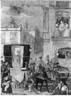
4 Johann Salomon Hegi, «Fiaker ohne Bock», Skizze Nr. 9 aus «Mexiko die Stadt», «Skizzen aus Mexiko», Aquarell. Privatbesitz.