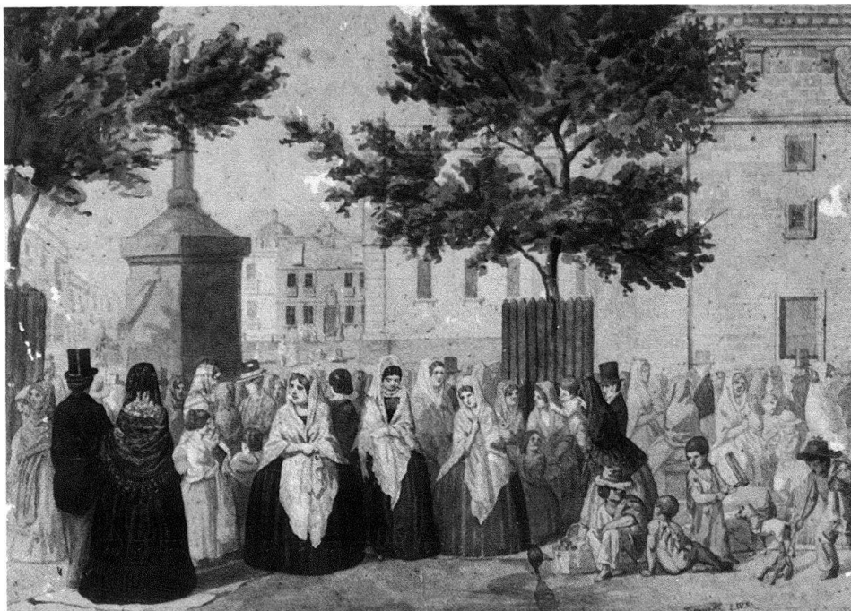
3 Johann Salomon Hegi, «El Viernes santo-Charfreitag», aus den «Skizzen aus Mexiko», 1850, Aquarell. Privatbesitz.