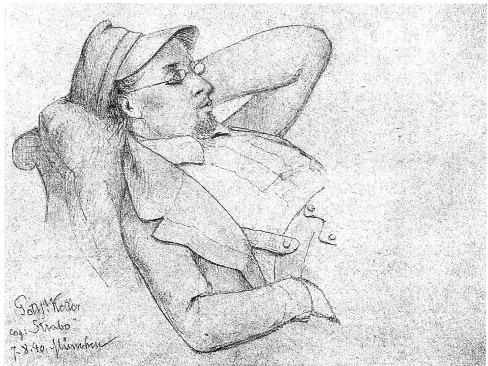
2 Johann Salomon Hegi, Gottfried Keller im Alter von 21 Jahren, 1840, Bleistiftzeichnung, 107×130 mm. – Die Zeichnung ist bezeichnet mit «Gottfd. Keller cog: Strabo (Kellers Kneipname). 7. 8. 40 München». Zentralbibliothek Zürich.

Dies ist der Grund, warum Hegi von der wissenschaftlichen Kunstgeschichte Mexikos bis heute nicht wahrgenommen werden konnte. Ausser den zwei gefundenen Bildern, dem Ölbild «La Catedral y el paseo de las Cadenas el Jueves Santo» 12 und dem Aquarell «Huatusco» 13 , hinterliess Hegi lediglich im Ausstellungskatalog der «Academia de San Carlos» und in einem Zeitungsartikel 14 Spuren. In Mexiko war Hegi bis kurz vor der Ausstellung im Castillo de Chapultepec 1989 unbekannt!