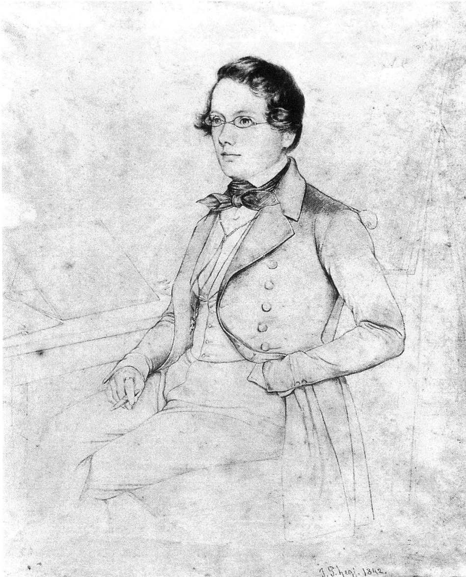
1 Johann Salomon Hegi, Selbstbildnis des Künstlers im Alter von 26 Jahren, 1842, Bleistiftzeichnung, 36×28 cm. Privatbesitz. – Von diesem Selbstbildnis existiert auch ein signierter und datierter Druck mit einem Wasserzeichen Orell-Füssli, 11,3×9 cm. Privatbesitz.

Erwartung Platz. Viel Geld sei nicht zu erhoffen, weil weder Bedürfnis noch Geschmack für Kunst existiere, schrieb er schon 1850 seinem Freund Gottfried Keller 6 .