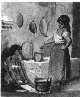
5 Johann Salomon Hegi, «Tortilleras», auf Blatt Nr. 65 aus «Mexiko die Stadt». Privatbesitz.