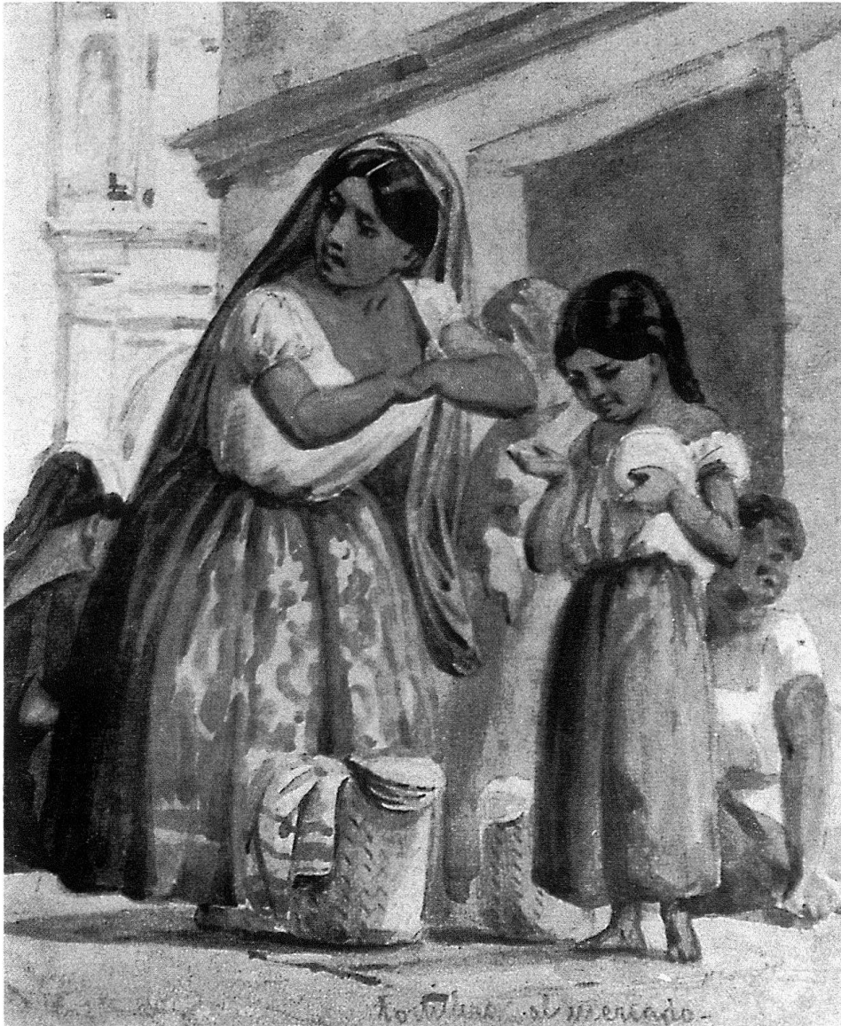
7 Johann Salomon Hegi, «Tortillera al mercado», Skizze Nr. 51 aus «Mexiko die Stadt», Aquarell. Privatbesitz.

Nach der Ausstellung im Museum Leuengasse Zürich 1988/89 erhielten die mehr als 1300 Aquarelle und Skizzen Hegis im Museo Nacional de Historia im Castillo de Chapultepec in Mexiko City (Oktober 1989) und im Anthropologischen Museum von Jalapa (Dezember 1989 bis Februar 1990) endlich die ihnen gebührende Beachtung.