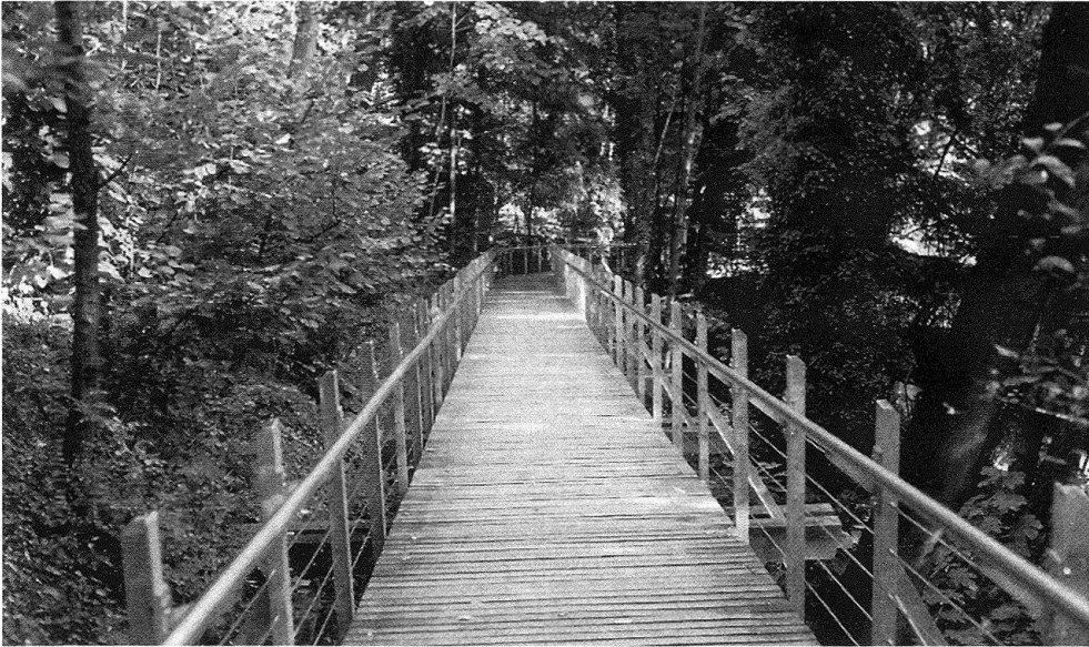
5 Der neu erstellte Zugang: der Steg zur Breite.

Zwischen Villenplatz und Sitzplatz wurde der Hangkante entlang ein wegbegleitender Strauchgürtel, dem englischen «belt» entsprechend, gepflanzt. Er verhindert auch den Abstieg in den Wald und macht den Waldsaum pflanzensoziologisch reichhaltiger.