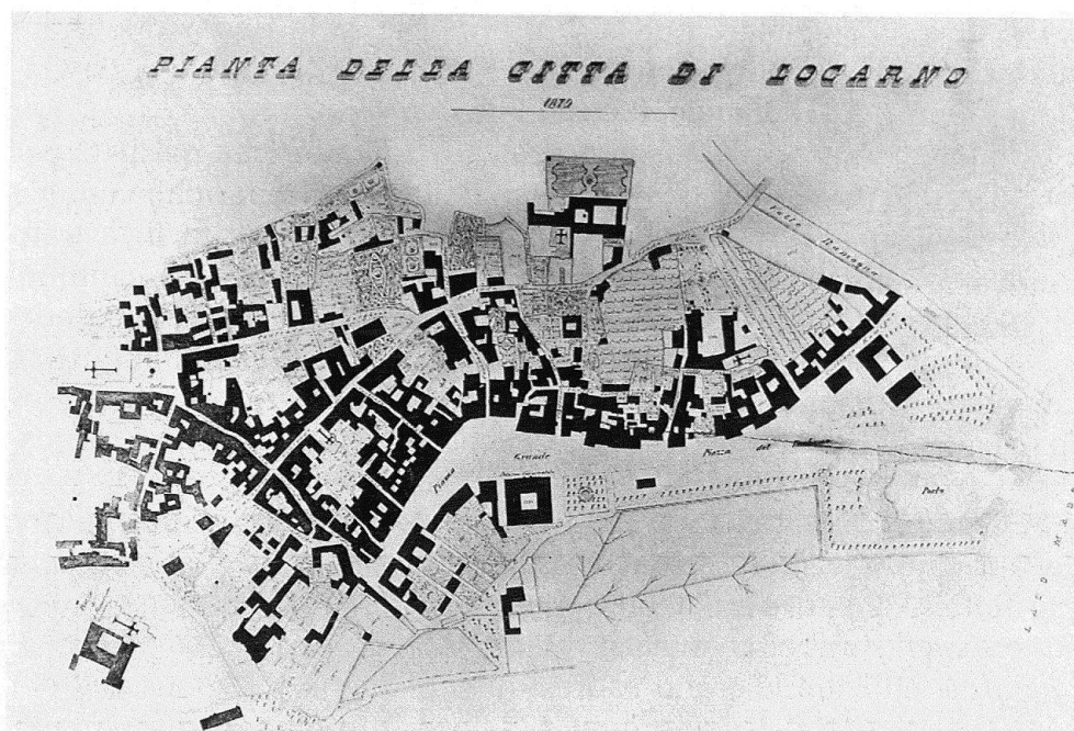
3 Pianta della città rilevata da Carlo Roncajoli nel 1879. (Locarno, Ufficio tecnico)

I locarnesi furono poi costretti dalle contingenze ad attribuire alle decorative zone verdi e alle zone di svago una maggiore importanza. Infatti negli anni Settanta e Ottanta, periodo di grave crisi economica e demografica, la salvezza della città pareva possibile solo mediante la nascente industria turistica: il giardino pubblico, elemento decorativo della città, assunse una nuova specifica importanza come elemento di un rinnovamento di più vasta portata. Il giardino pubblico divenne (come l'auspicato teatro, «quai», ecc.) importante fattore di decoro e luogo d'intrattenimento, uno strumento cioè per favorire il turismo. Si legge infatti in un commento della commissione al resoconto municipale per il 1879: «Un'altra cosa che ci limitiamo solamente di proporre da raccomandarsi alla Municipalità si è di vedere modo di ottenere che la Banda Civica alla quale per il solito intervento alle feste patriottiche e funzioni religiose si corrisponde la somma di franchi 500, abbia nella bella stagione qualche volta a rallegrare un po di sé i cittadini ed i forestieri nei nostri pubblici giardini fosse anche regalandola di qualche centinaja di franchi di più». Infatti, pur fidando «nel suo bel cielo, e nel suo dolce clima», la «Nizza della Svizzera» doveva impegnarsi a «tenersi come una bella Dama più ornata ed attraente che sia possibile, perché i suoi amatori non abbiano a trovare che presso di lei si muore di noia [...]» 9 .