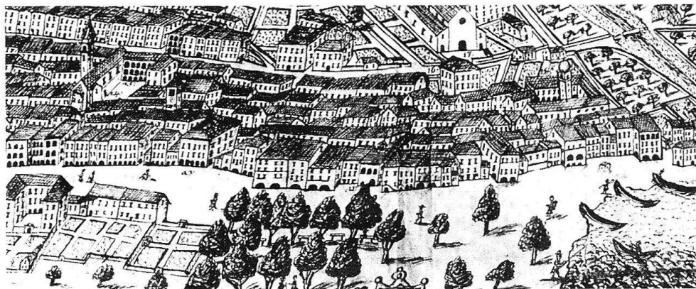
2 Particolare dalla veduta panoramica di Antonio Orelli de' Capitani(?), 1805.

Il giudizio su questi fatti non deve essere troppo severo. Bisogna considerare la precaria situazione sociale ed economica di molti abitanti della città, oltre che l'inconsistenza di infrastrutture oggi usuali quali un servizio di nettezza urbana o una rete di fognature funzionante. Ed anche i giardini privati avevano pertanto in primo luogo una funzione economica e pratica piuttosto che estetica o di svago: vi erano situati l'orto e le piante da frutto, spesso servivano (benché vietato a tutela della salute pubblica) da latrina, da letamaio o da discarica per i rifiuti domestici 8 .