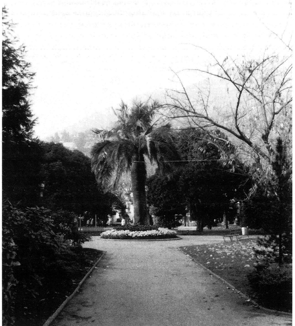
6 Uno dei viali con vegetazione subtropicale.