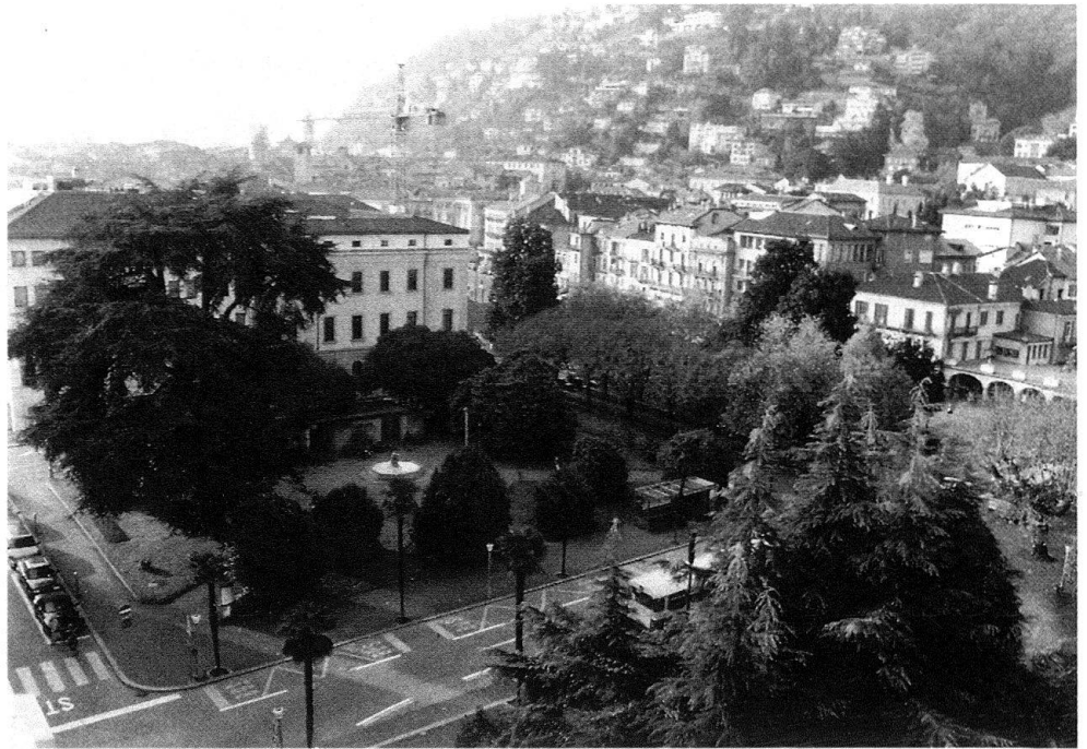
5 I «giardini» fra la vecchia posta (poi UBS) e il Teatro di Locarno (Kurssaal), visti da sud-est, 1992.