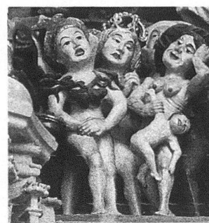
1 Tympanon des Berner Münsterportales, Detail von der Seite der Verdammten: Eine Hure und eine Kindstöterin.

Aus einem spezifischen und deshalb bewusst eingeschränkten Blickwinkel soll hier versucht werden, so betont belehrende Kunstwerke wie Weltgerichtsdarstellungen zu betrachten im Hinblick auf die Bilder von Frauen und von Weiblichkeit, die sie entwerfen und verbreiten. Da es, auch für die spätgotische Zeit, nahezu keine Literatur zum Thema «Bild der Frau» gibt, ist sowohl ein Überblick als auch die Bewertung der Einzelfälle an dieser Stelle kaum möglich. Ich kann deshalb nur anhand dreier konkreter Beispiele, des Berner Münsterportales, der Rückseite des Flügelaltares von Stürvis und einer Tafel des Michaelaltares des Zürcher Nelkenmeisters, Beobachtungen und Fragen skizzieren, deren Mass an Allgemeingültigkeit in einer breiteren und differenzierteren Untersuchung beurteilt werden müsste.