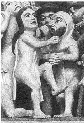
3 Tympanon des Berner Münsterportales, Detail von der Seite der Verdammten: Eine unkeusche Nonne und ein Mönch.