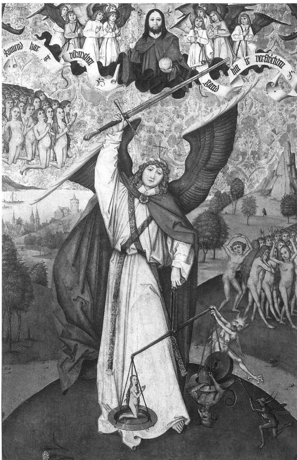
9 Zürcher Nelkenmeister, Jüngstes Gericht, Erzengel Michael als Seelenwäger.

Seelenwägungsbildern, dass es sich bei der Geretteten um eine Frau handelt 18 . Möglicherweise gibt dies einen Hinweis darauf, dass mit einer weiblichen Auftraggeberschaft zu rechnen ist 19 . Die Stimmung des Bildes ist verhalten. Die Reue der Verdammten in ihren rückwärtsgewandten Blicken zum Ausdruck zu bringen war wichtiger, als mit drastischen Bildmotiven die Qualen der Hölle zu schildern. Die Auftraggeberschaft wollte offenbar nicht mit emotionsgeladener Drastik, sondern mit subtileren Mitteln belehren – dies vielleicht