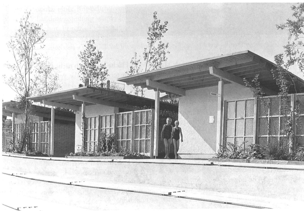
2 Max Frisch, Schwimmbad Letzigraben, kleinteiliger Massstab und Verzahnung von Architektur und Natur, 1942–49.

ger: «Der Architekt, und wäre er ein Genie, ist nicht der Gestalter der Gesellschaft; er ist nur berufen, der vorhandenen oder gewollten Gesellschaft das entsprechende Gehäuse zu schaffen, ihre Bedürfnisse zu befriedigen und ihren Geist zum Ausdruck zu bringen: als Fachmann. Als Bürger, ja, als Mitglied der Gesellschaft freilich kann er, was jeder kann, nämlich Anteil nehmen an der Bildung der Gesellschaft» 9 . Seine Vorstellung einer Demokratisierung der Stadtplanung war von der Hoffnung auf eine veränderte Gesellschaft demokratisch-verantwortungsbewusster Bürger getragen. Wirkliche Demokratie erfülle sich erst durch das Mitspracherecht des aufgeklärten Bürgers. Und sein unbequemer Vorschlag zur Tat galt der Meinungsbildung des Bürgers.