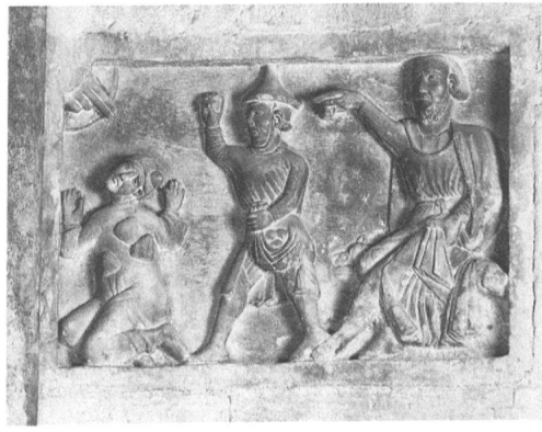
6, 7 Trient, Dom, Apsisrelief der Steinigung des Stephanus, Anfang 13. Jahrhundert. – Die Reliefs sind unsymmetrisch, aber der konkaven Biegung der Seitenapsis folgend angeordnet.

der Verwendung der alten Steine bei allfälligen Umbau- oder Erneuerungsarbeiten ausgehen.