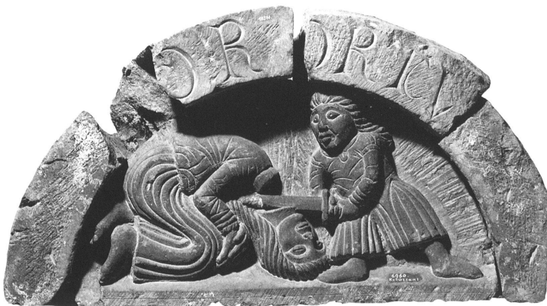
12 Schaffhausen, Lünette, Enthauptung des Johannes des Täufers, Ende 12. Jahrhundert.

Da Lünetten, Inschriftenbogen und Kragsteine aufeinander abgestimmt sind und die massiven Steine eine Versetzung im kompakten Mauerverbund nahelegen, ist ein ursprünglicher Anbringungsort am Münsterbau selbst, wie beispielsweise in Brenz, Königslutter oder Parma denkbar. Einer Platzierung im Chorbereich widerspricht jedoch die gradflächige Reihung der Lünetten, die weder eine konvexe (Brenz) oder konkave Biegung (Trient) noch Verwitterungsspuren aufweisen. Andererseits deuten die auf Fernsicht konzipierten Darstellungen und die grossen Buchstaben der Inschriftenbögen auf einen erhöhten, gut sichtbaren Anbringungsort hin.