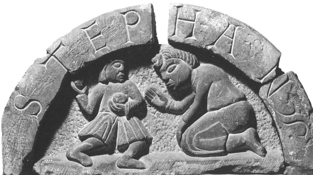
8 Schaffhausen, Lünette, Steinigung des Stephanus.

Vergleicht man diese dreiteilige Stephanussequenz mit zwei zusammengehörenden Relieftafeln aus der Seitenapsis des Doms von Trient, so lässt sich aufgrund ikonographischer Übereinstimmung die Traditionsgebundenheit des wiedergegebenen Stephanus-Martyriums feststellen. Darstellungsmotive wie der sitzende Saulus mit Zeigegestus, die erhobenen Hände und das Schrittmotiv der Steiniger, der kniende Stephanus, den ein Stein gerade am Kopf trifft und der gemäss Apg. 7, 60 die Hände zum Gebet erhebt und Gott um Vergebung für seine Peiniger bittet, bilden unübersehbare Analogien trotz unterschiedlicher Attributgestaltung (Hüte, Steinmenge, Saulussitz). Abweichend ist die kompositionell bestimmte Zahl der Steiniger, die Handstellung von Stephanus und das im Lünettenzyklus gänzlich fehlende Element der segnenden Hand Gottes. Die Gedrungenheit der Figuren erscheint als typisches Merkmal der