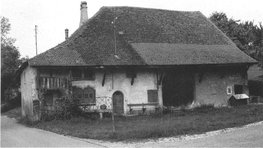
Châtillon FR, ferme double n° 14/15 avant la démolition, façade est du bâtiment n° 15. – A gauche, l'extension du bâtiment abrite un four; à droite, on observe une porte à linteau cintré en partie murée.

lon, en limite du domaine public, fut laissée à l'abandon durant de nombreuses années. Les autorités locales sont intervenues à plusieurs reprises auprès de nouveaux propriétaires, les sommant d'entretenir leur immeuble. Ceux-ci, pour des raisons de basse conjoncture défavorable aux promoteurs, ont réalisé qu'ils n'auraient plus les moyens d'entreprendre une restauration. Pour des raisons de sécurité, la démolition fut ordonnée par la Préfecture de la Broye le 28 juillet 1993. Il est à relever que le bâtiment était inscrit au plan d'aménagement local comme objet digne de protection.