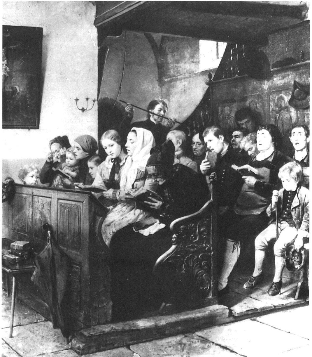
1 Marc Louis Benjamin Vautier, Andächtige in der Dorfkirche , 1858, Öl auf Leinwand, 85×73 cm. Stiftung Kunsthau Heylshof, Worms.