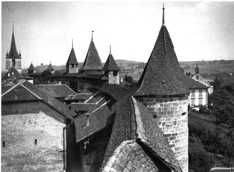
6 Murten FR, nationales Pilotprojekt zum Europäischen Denkmalschutzjahr 1975. Blick auf die wohlerhaltene mittelalterliche Wehrmauer; links aussen der Turm der reformierten Pfarrkirche.

Am 6. Mai 1963 wurde die Schweiz Mitglied des Europarates, der ältesten supranationalen politischen Organisation Europas und der einzigen, der wir bis heute angehören. In diesem Beitritt wird eine aussenpolitische Neuausrichtung fortgesetzt, die bereits ausgangs des zweiten Weltkriegs unter Bundesrat Max Petitpierre und seiner Devise Neutralité et Solidarité eingeleitet worden war. Im gleichen Jahr setzten auch die Bestrebungen des Europarats auf dem Gebiet der Denkmalpflege ein, gestützt auf eine Empfehlung (365), die von der parlamentarischen Versammlung gutgeheissen worden war. Dem Ministerkomitee wurde die Einleitung einer europaweiten Aktion zur Rettung des baulichen Erbes nahegelegt. Die wirtschaftliche Erholung Europas war seit dem Beginn der sechziger Jahre in