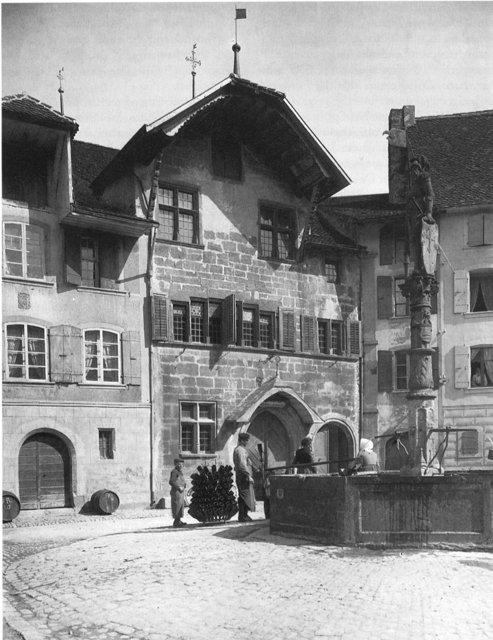
7 Le Landeron, Pilotprojekt des Kantons Neuenburg zum Europajahr für Denkmalpflege und Heimatschutz 1975. Blick auf das Rathaus, in dessen Erdgeschoss die katholische Kirche untergebracht ist, und den Mauritiusbrunnen. Historische Aufnahme von 1909.

dem lokalen Geschäft gegenüber wesentlich gesteigerten Warenangebot brachen mit modern gestalteten, fensterlosen Neubauten in eine kleinräumige Welt, zu der sie keine Beziehung fanden.