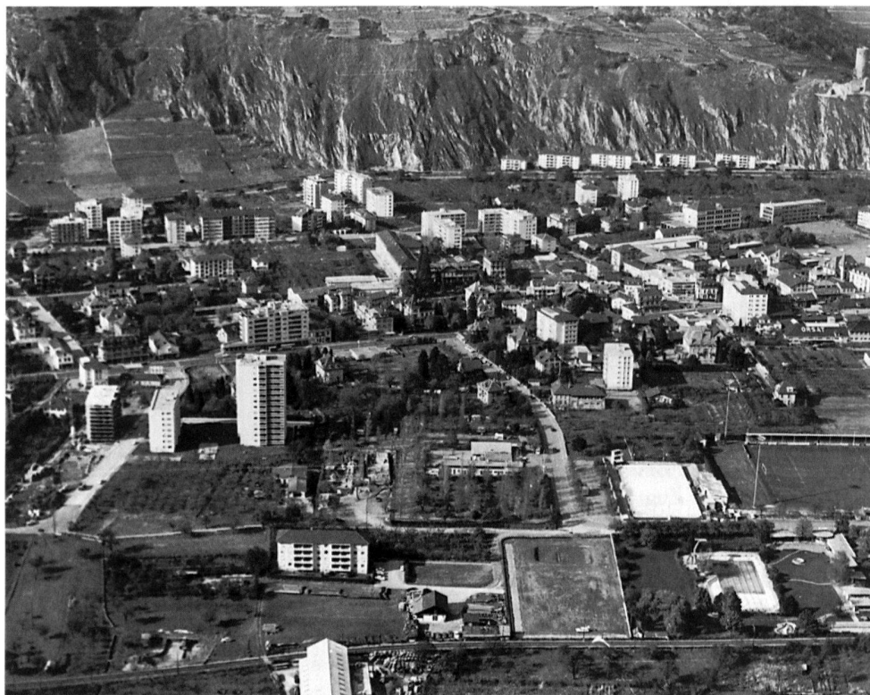
8 Martigny VS, das römische Octodurus. Nationales Pilotprojekt zum Europäischen Denkmalschutzjahr 1975. Flugaufnahme 1972 mit Blick auf das rapide Wachstum der Siedlung nach dem zweiten Weltkrieg. Die archäologische Zone, deren weitgehende Freihaltung damals erreicht werden konnte, liegt am unteren Bildrand. Das Gebiet der gemeindeeigenen Sportanlagen in der rechten Ecke unten wie auch die im Bild nicht sichtbare Ruine des römischen Amphitheaters wurden vorsorglich durch den Bund erworben, das Amphitheater restauriert.

Eine Ministerkonferenz in Brüssel zog im November 1969 den Schlussstrich unter die erste Etappe europäischer Zusammenarbeit auf dem Gebiet der Denkmalpflege. Sie stellte auch die Weichen für die Zukunft. Die Voraussetzungen für eine Aktion in breiterem Rahmen hatten sich inzwischen erheblich verbessert. So hatte zum Beispiel die während mehreren Jahren vom schweizerischen Nationalrat Bernard Dupont, Präsident der Walliser Gemeinde Vouvry, präsidierte Europäische Konferenz der Gemeindebehörden mit allem Nachdruck die Verantwortung betont, die den Ortsbehörden bei der Verwirklichung einer zielgerichteten Politik für Schutz und Erhaltung des baulichen Erbes zukommt; ihre Anstrengungen müssen sich allerdings auf einen breiten Konsens ihrer Wähler und der ganzen Bevölkerung abstützen können. In einer Entschliessung von 1970 (65) sekundierte sie den Bestrebungen des Ministerkomitees und der beratenden Versammlung, und die von ihr angeregte Konferenz der historischen Städte in Split zum Beispiel bildete den Auftakt zu einer internationalen Zusammenarbeit auf dem Gebiet der Ensemble-Denkmalpflege; sie blieb fürs erste zwar auf den persönlichen Kontakt und Informationsaustausch