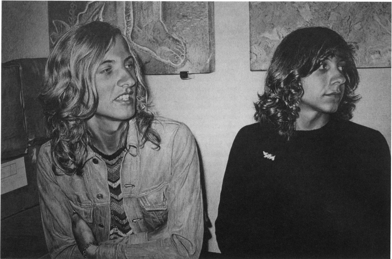
1 Franz Gertsch, Franz und Luciano , 1973, Acryl auf ungrundierter Baumwolle, 198×298 cm. Kunsthaus Zürich.

rer Attitüde». Die Folge: «Depravierung des Kunstwerks zur Ware» 10 .