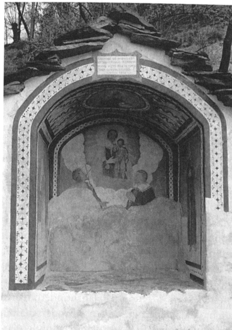
6 Cavigliano. Detailansicht der Wegkapelle von 1740 (siehe Abb. 1) mit dem Gerippe.