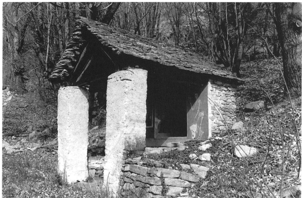
1 Cavigliano, Ansicht der Wegkapelle «Capela du Peri», am alten Weg nach Auressio (Onsernonetal). – Laut Inschrift 1740 von Giacomo Peri aus Cavigliano gestiftet. An der rechten Front ist der Tod als Gerippe sichtbar; links sind die Armen Seelen dargestellt.

Um dem materiellen Verfall Einhalt zu gebieten oder entgegenzuwirken und um den Wert dieser kleinen Denkmäler in vermehrtem Masse auch der einheimischen Bevölke-