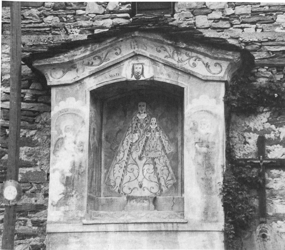
5 Gordevio. An Hausmauer angelehnter Bildstock von 1771 mit leicht geschwungenem Giebel. In der Nische die Madonna di Loreto (oder Einsiedeln?). Am Scheitel «il Santo Sudario» (das Tuch der Veronika), an den Seiten die hl. Joseph und Johannes der Täufer.

ranten des katholischen Glaubens in gegenreformatorischer Zeit 14 .