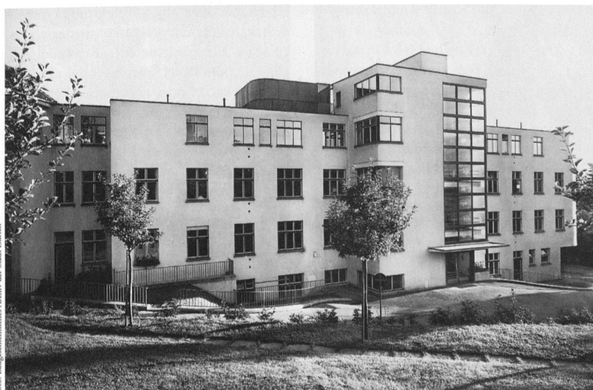
Zürich, Kinderspital, «Oberes Haus», 1931, von Otto Rudolf Salvisberg, Nordfassade mit Haupteingang, Zustand von 1935.

Auf dem Kinderspitalareal sind umfassende Erweiterungen geplant, welche den Abbruch des «Oberen Hauses» vorsehen. In diesem Zusammenhang war es Aufgabe der Denkmalpflege, sämtliche Bauten des Kinderspitalkomplexes auf ihre kunst- und kulturhistorische Bedeutung hin zu überprüfen. Von den sechs untersuchten Bauten – das 1969 fertiggestellte Hauptgebäude ausgenommen – wurden lediglich zwei unter Schutz gestellt, obwohl auch die übrigen Häuser architektonische Qualitäten aufweisen. Die Spitalleitung wirft nun der Denkmalpflege vor, das Neubauvorhaben durch die unerwartete Unterschutzstellung zu verhindern. Betroffene Eltern entrüsteten sich verständlicherweise, denn sie und ihre kranken Kinder sind die Leidtragenden, wenn die Missstände im «Oberen Haus» kein baldiges Ende finden. Leider vermittelte die einseitige und wenig objektive Berichterstattung in der Tagespresse einen verfälschten Eindruck der tatsächlichen Situation. Mit Schlagzeilen wie «Denkmalschutz gegen krebskranke Kinder» schürte sie die emotionsgeladene Diskussion und führte statt zur Klärung zu einer Verhärtung der Fronten. So erfuhr die Öffentlichkeit nicht, dass die Spitalleitung durch die Denkmalpflege bereits vor drei Jahren über die Schutzwürdigkeit des «Oberen Haus» informiert wor-