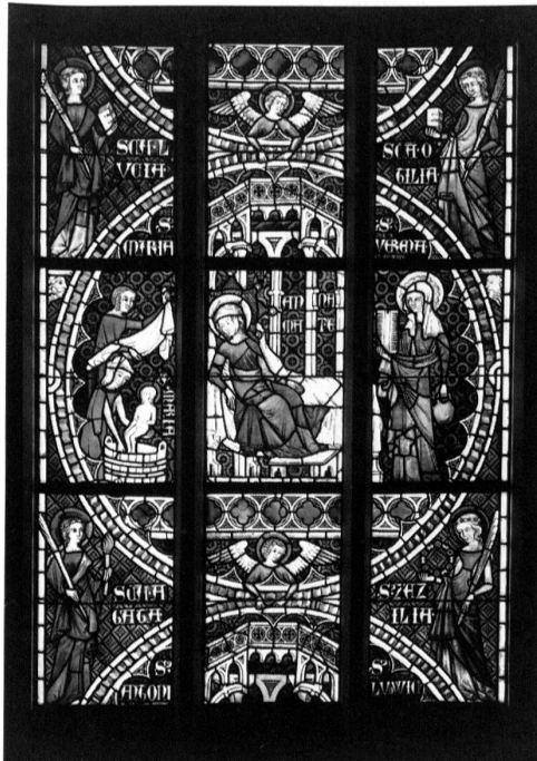
Glasfenster von Königsfelden, der Grablege König Albrechts I. aus dem Hause Habsburg, Ausschnitt aus dem Anna-Fenster, um 1328.