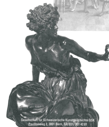
Gesellschaft für Schweizerische Kunstgeschichte GSK Pavillonweg 2, 3001 Bern, Tel./031/301 42 81