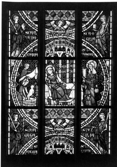
Glasfenster von Königsfelden, der Grablege König Albrechts I. aus dem Hause Habsburg, Ausschnitt aus dem Anna-Fenster, um 1328.

Für Auskünfte steht zur Verfügung: Herr Burgerratspräsident Rudolf v. Fischer, Vizepräsident der Aufsichtskommission, Amthausgasse 5, Postfach, 3000 Bern 7 (Tel. 031/311 43 01).