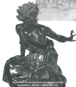
Gesellschaft für Schweizerische Kunstgeschichte GSK, Eszylhofweg 2, 3001 Bern, Tel. 031/7 01 42 81