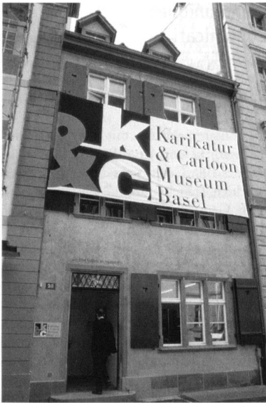
Basel, renoviertes Vorderhaus des neu eingerichteten Karikatur & Cartoon Museum.

Gleichzeitig mit der Eröffnung der neuen Ausstellung Architekt-ur-Welten feierte das Karikatur & Cartoon Museum Basel im Mai dieses Jahres seinen Umzug in neue, vergrösserte Räumlichkeiten. Der Ortswechsel vom Gebäude in der St. Alban-Vorstadt 9 in das schräg gegenüber gelegene Haus Nr. 28 hatte sich aufgedrängt, da die alte Liegenschaft aufgegeben werden musste und sich beim spätgotischen Schindelmacherhaus eine Erweiterungsmöglichkeit bot. Auf der schmalen, weit in die Tiefe reichenden mittelalterlichen Parzelle von ca. 6 × 25 m wurde nach dem Abbruch der Hofüberbauung im rückwärtigen Teil des Grundstücks zusätzliche Nutzfläche frei. In diesen Hinterhausschacht applizierten die Basler Architekten Herzog & de Meuron eine über drei Stockwerke führende Ausstellungsvitrine aus Beton und Glas. Vom spätgotischen Vorderhaus, das die Architekten für die Zwecke des Museums sanft renoviert haben, ist der Neubau im Erdgeschoss durch einen Hof getrennt, in den