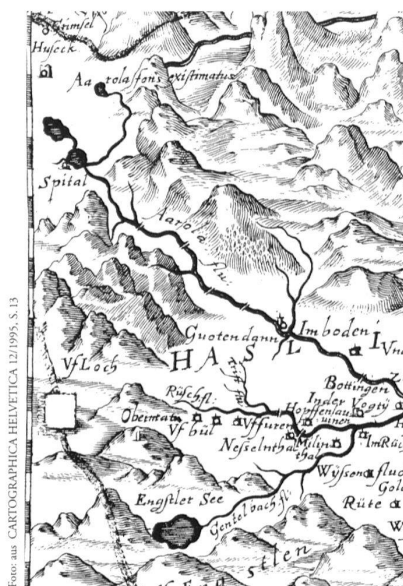
Ausschnitt aus der Karte des bernischen Staatsgebietes 1638 von Joseph Plepp.

Die Kartenspezialisten haben in jüngster Zeit organisatorische Strukturen geschaf-