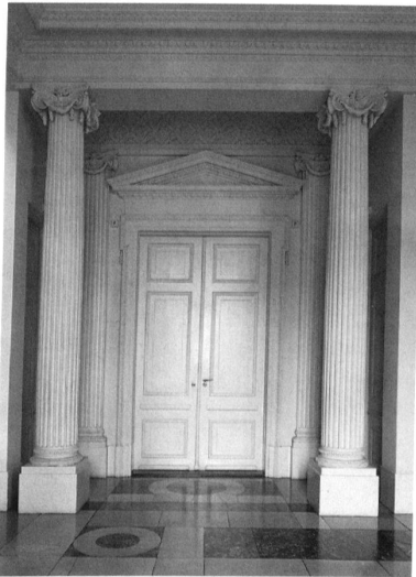
Basel, Haus zum Kirschgarten, 1775–1780, Blick vom Vestibül der Beletage zum Eingang des Grossen Salons.

Die Begleitpublikation zur Ausstellung Sehnsucht Antike , welche zwischen dem 17. November 1995 und dem 28. April 1996 im Haus zum Kirschgarten des Historischen Museums sowie der Skulpturenhalle Basel gezeigt wurde, nimmt sich einer grossen bisherigen Forschungslücke der Kunstgeschichte Basels an. Die vor rund zwanzig Jahren europaweit einsetzende Do-