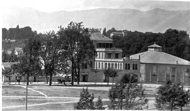
Vue sur l'avenue du Mail et la place du Cirque. À droite, l'ancien Cirque Rancy, avant sa reconstruction en 1898. Au centre, la villa Santoux qui abrita dès 1861 le Musée des Alpes.