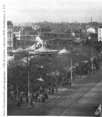
Vue sur le Cirque Rancy en 1902, après sa reconstruction, et la plaine de Plainpalais investie par des forains.