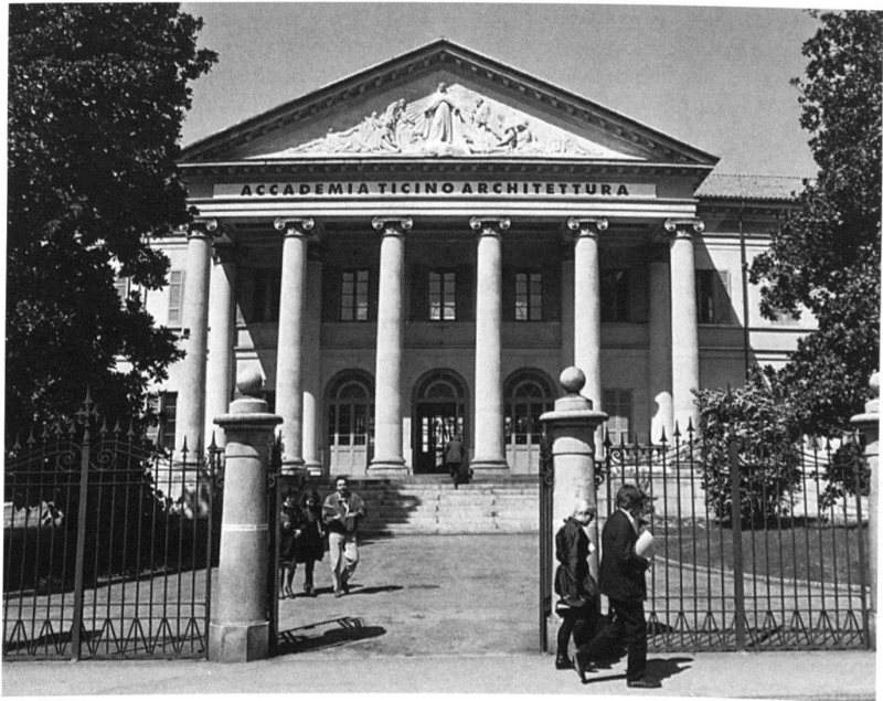
Mendrisio, die Accademia di architettura der Università della Svizzera Italiana im ehemaligen Palazzo Turconi.

Die Tessiner Universität wird sich hüten, den Minderheitsbonus und die Argu-